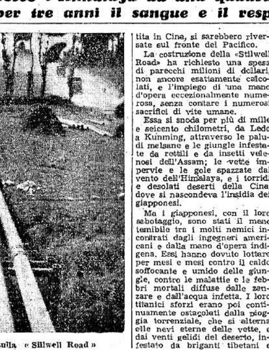
Un tratto degli oleodotti sulla «Stillwell Road»

Washington, gennaio. Solo ora sono stati resi noti ufficialmente i dati riguardanti la misteriosa «Stillwell Road», la «Strada di Stilwell», che per anni è stata circondata dal segreto più assoluto, di fronte al quale anche lo spionaggio nemico si è rivelato impotente.