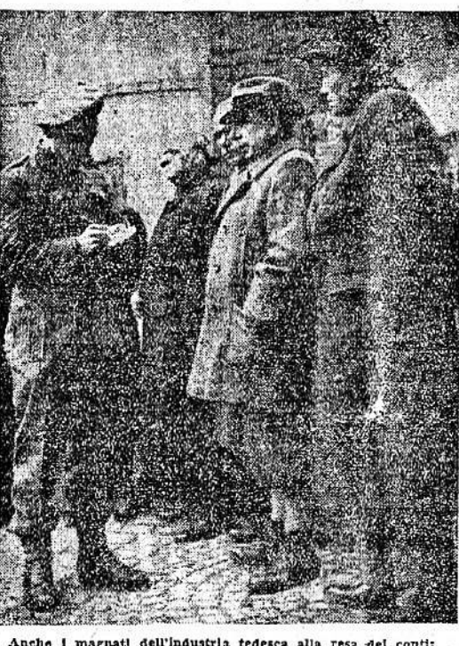
Anche i magnati dell'industria tedesca alla resa dei conti: ecco un interrogatorio che accorderà le loro responsabilità.

Roma, 15 gennaio. Le riserve di grano per la panificazione, ammontanti a 354 mila tonnellate al primo dicembre, erano ridotte al 31 dicembre a 208.000 tonnellate, secondo una notizia delle Note economiche della Commissione Alleata e dell'U.N.R. R.A. Delle 208.000 tonnellate di grano disponibili, 145.000 erano di produzione italiana concentrata soprattutto nelle Marche, nell'Umbria, nell'Emilia e in Toscana. Le altre 63.000 tonnellate di riserva sono in corso di distribuzione nei porti e si stanno distribuendo ai magazzini centrali e provinciali. Tale riserva però non è sufficiente ed occorre integrarla fino ad arrivare ad un minimo di 320.000 tonnellate (circa un mese di consumo).