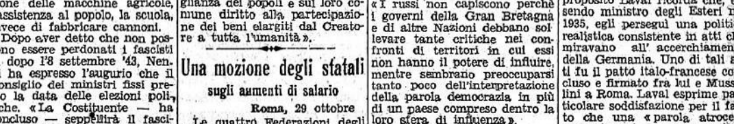
Una mozione degli statali sugli aumenti di salario