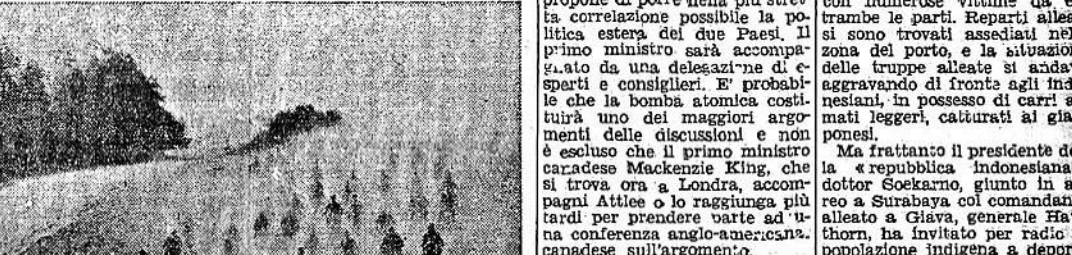
Una suggestiva sfilata di reparti motociclisti dell'Armata inglese