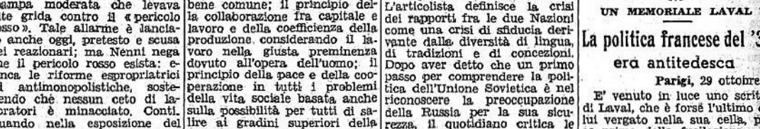
Un appello di Pacciardi a Bologna - Dichiarazioni di Berlinguer - Discorsi di Nenni e di Lussu - I cattolici e la Costituente