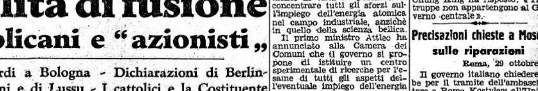
Possibilità di fusione fra repubblicani e "azionisti"