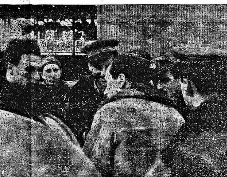
Piloti italiani del secondo Gruppo caccia di ritorno da una missione vittoriosa

«Alcuni terreni bolscevichi per le istituzioni bolsceviche» Stoccolma, 26 marzo Per ordine di Mosca il Ministro della propaganda romano ha soprappreso il «Timpul» e un quotidiano di provincia a tendenza nazionalista antisovietica. La «Reuter» fornendo questa informazione annuncia che prossima-