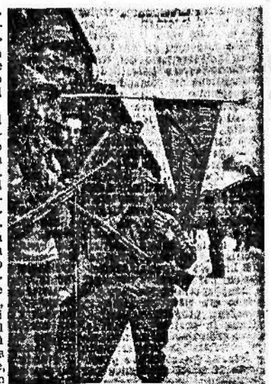
Fede e fermezza nei volti