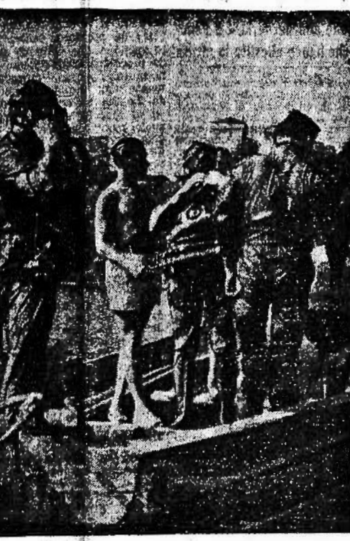
Sommatori della "X Mas" pronti per l'immersione

Un incrociatore, tre cacciatorpediniere, due corvette e sette trasporti affondati nella Baia della Senna da mezzi offensivi della marina