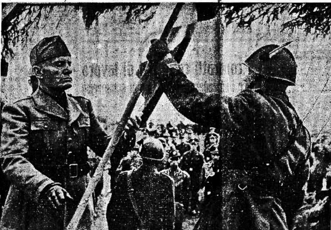
Il Duce consegna le bandiere alle divisioni italiane pronte al combattimento

Il saluto del Duce Oggi il Maresciallo d'Italia Rodolfo Graziani ha assunto il comando di una armata italo-germanica rivolgendosi alle truppe il seguente ordine del giorno: