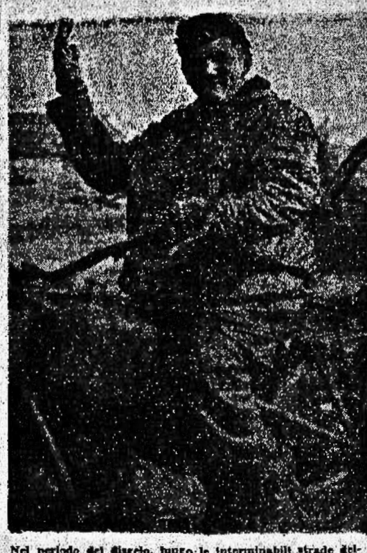
Nel periodo del giugno, lungo le interminabili strade del Nord, i portatori di fango...