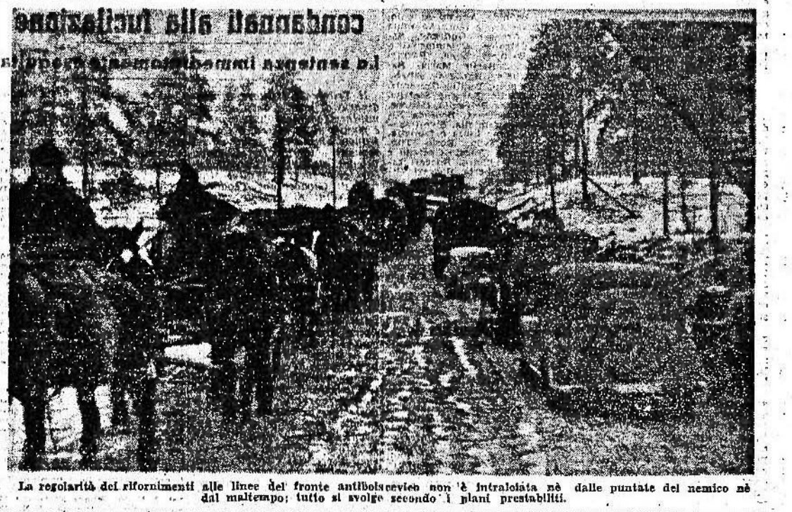
La regolarità dei rifornimenti alle linee del fronte antibolscevico non è intralciata né dalle puntate del nemico né dalle punte del nemico né dalle punte del nemico...

Washington avrebbe deciso di gettare a mare Badoglio Da qualche tempo fa che a Washington si sta decidendo di gettare a mare Badoglio.