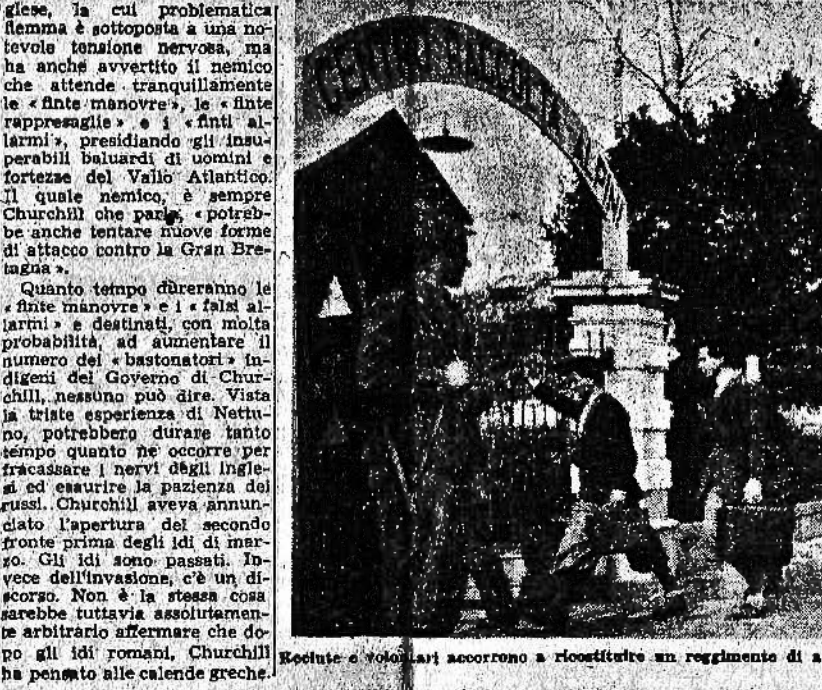
Reclute e volontari accorrono a ricostituire un reggimento di alpini dell'Esercito repubblicano

« Radiolondronerie... » « Combattimenti per le strade a Bologna, Firenze, Bergamo e Milano... »