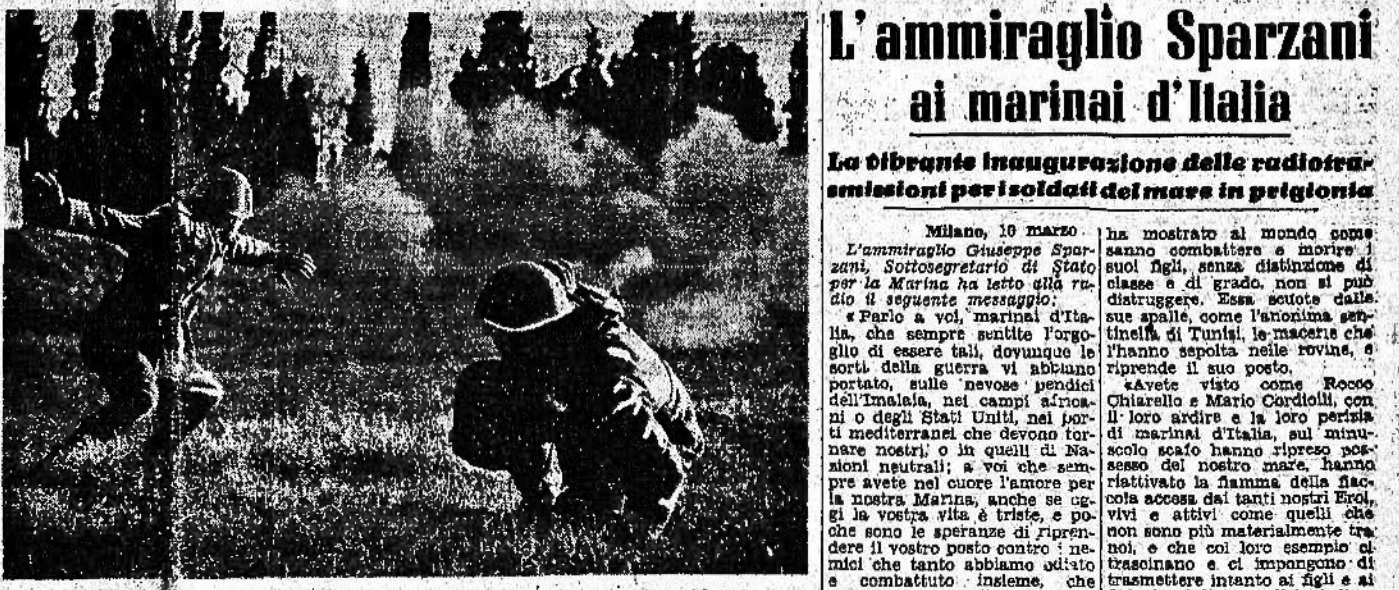
Esercizi di tiro dei soldati repubblicani nel lancio di bombe a mano

Tokio, 10 marzo. Il Tokyo Shimbun, commentando la decisione degli alleati circa la sorte assegnata alla flotta italiana, dopo aver sottolineato che il colpo è stato colossale, dice che una squadra operativa nel Mediterraneo rappresenta per l'Imperialismo britannico un serio pericolo.