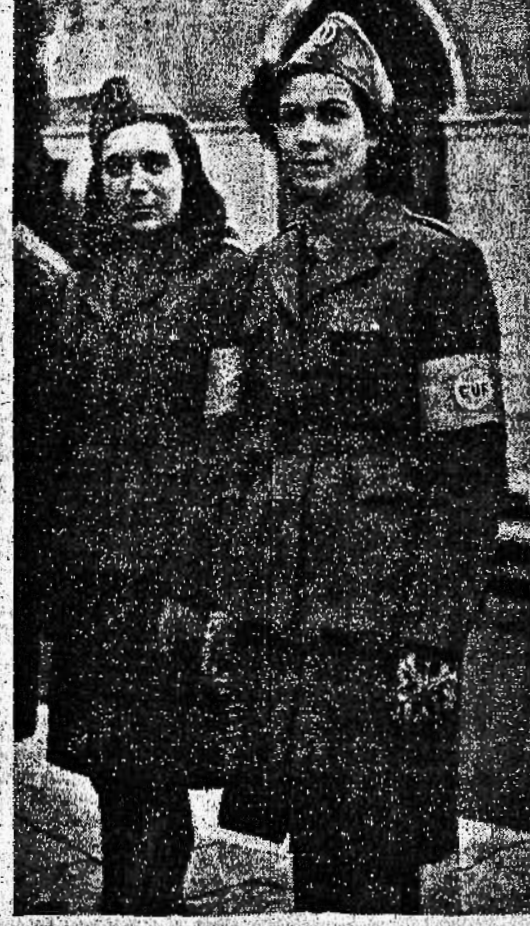
Non si è verificato alcun con-

Milano, 8 marzo. Una volta al Centro di arruolamento volontario istituito dalla Federazione presso la sede del Fascio femminile repubblicano può dare una confortante dimostrazione di come le donne milanesi, dopo l'incapace disimpegno dei maschi, provino un fervore di patriottismo, che hanno reso vano sino ad oggi lo sforzo tentato dal nemico.