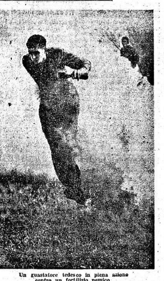
Un guastatore tedesco in piena azione contro un fortino nemico

Gli alterni combattimenti difensivi sui versanti di Kremenjuc continuano con immutata violenza. Numerosi carri armati nemici sono stati distrutti. Nella zona di Cereassi gravi attacchi nemici si sono alternati per tutta la giornata a contrattacchi germanici. In questi combattimenti il nemico ha perduto, oltre a numerosi morti, 24 carri armati.