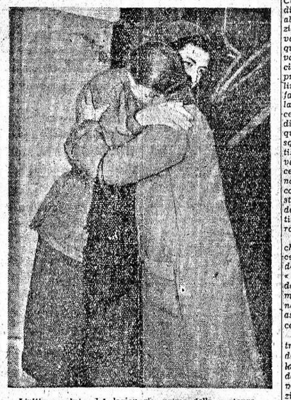
L'ultimo saluto del legionario, prima della partenza, è per la cara mamma

«Ecco, se rialza il capo — pensavo — non potrà essere a meno di guardarmi ancora; e io gli chiederò allora spiegazioni... Desidero sapere perché poco fa mi avete guardato a quel modo, signore... Dovrà pur rispondere. E se non risponde mi farò sentire, lo ingiurierò, lo scrollerò fino a fargli uscire fuori il suo segreto, il perché di quello sguardo. «Che sia un conoscente o un amico dell'«Torda»? mi venne in mente d'un tratto. Poteva benissimo essere, e spiegarsi tutto allora. Solo, quel finger così di dormire, perché? E poi, poi benissimo fino a un certo punto sarebbe stato un caso straordinario anzi. Guardai il vecchio: «No, quello dorme solo, quello dorme davvero — pensai — ma quest'altro? L'idea che non dor-