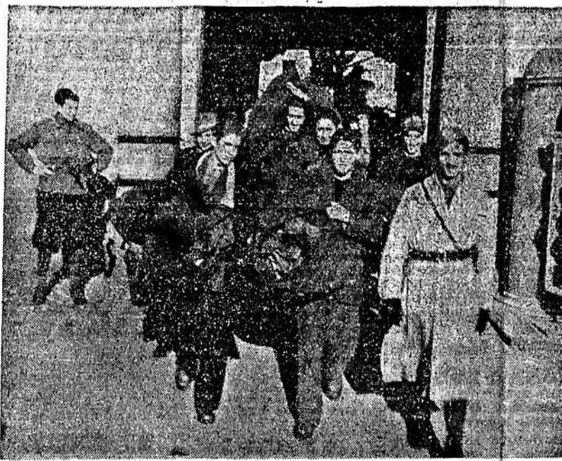
In una caserma delle FF. AA. dopo la presentazione si procede alla vestizione delle reclute del 1924-25

Soprattutto bisogna guardarsi dal provocare una irrimediabile frattura fra città e campagna. E' assolutamente indispensabile pertanto che tutti i rurali, a qualsiasi categoria appartengano, rientrino nella linea dell'integrale rispetto delle discipline annonarie specialmente in materia di consegna agli ammassi. Le evasioni devono riprendere la dimessa delle discipline annonarie conformi alla regola, eccezioni che inevitabilmente ci saranno sempre, giacché anche le masse rurali sono composte di uomini e non di angeli.