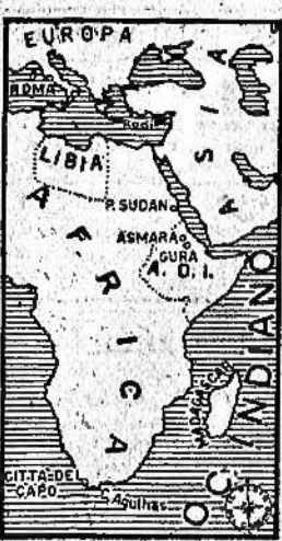
EUROPA LIBIA SUDAN A.O.I.

Tutti gli apparecchi partecipanti all'impresa sono regolarmente rientrati alla base all'alba di ieri, dopo aver compiuto voli che hanno durato, a seconda delle distanze percorse, da un minimo di 23 ad un massimo di 24 ore.