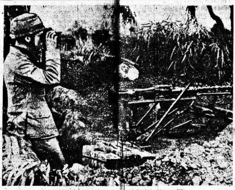
Posto avanzato tedesco sul Don