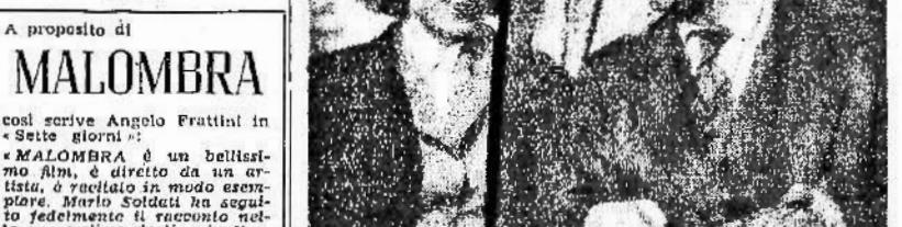
GINO CERVI - ADRIANA BENETTI nel film «Quattro passi fra le nuvole» di produzione Cines Amato - Esclusivita E.N.I.

Tutti gli uomini sono personaggi di un dramma, la vita, per essere divertita, ha bisogno di essere inventata. Quella vera, eccola da tutti i giorni non fallere, semmai fa sorridere e cer-