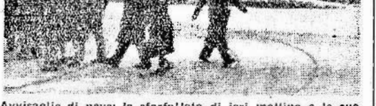
Avvisaglie di neve: la sferzante di ieri mattina e le sue immediate conseguenze: dovunque un po' di cipria

La Sezione provinciale dell'Amministrazione pubblica: Da oggi è in distribuzione presso tutti gli esercenti del Comune di Bologna un uovo per ogni prenotazione effettuata per il mese di dicembre. Il prelievo avverrà mediante esibizione della carta annunaria per generi alimentari vari di questa emissione e mediante distacco da parte del consumatore del buono di prelievo n. 11.