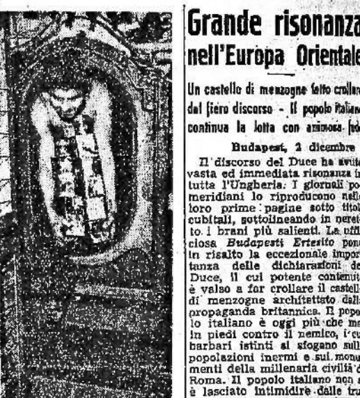
Buone notizie a bordo di un sommergibile italiano.

Roma, 2 dicembre. Il popolo italiano ha ascoltato con religiosa attenzione la parola del Duce, parola che segna la storia e il destino della Patria. Il Duce ha parlato di guerra, di sacrificio, di onore, di gloria, di vita eterna.