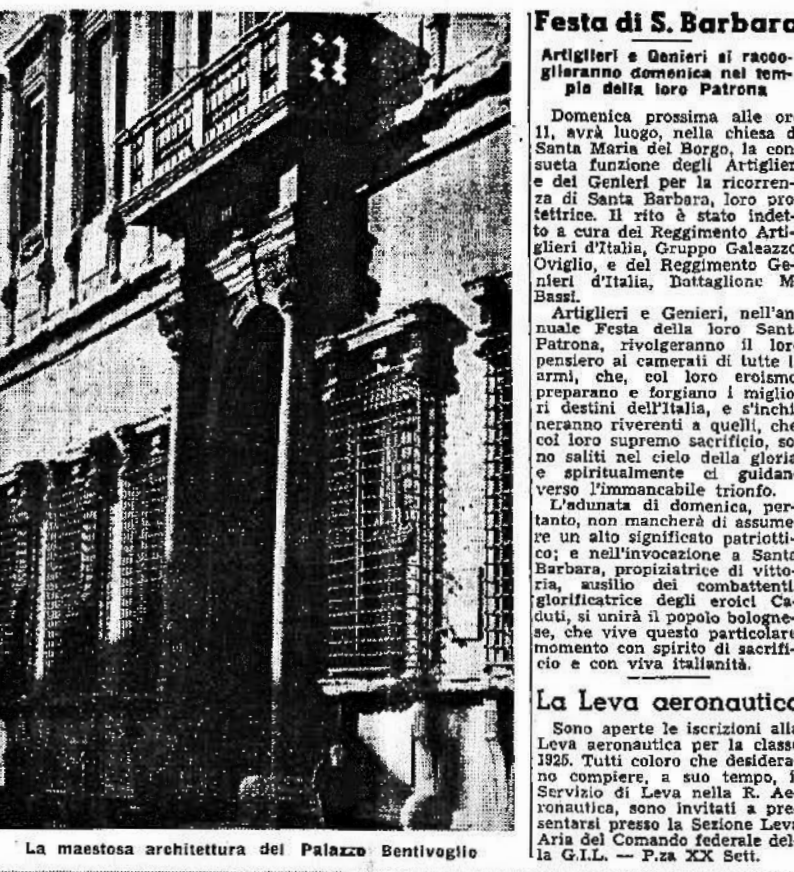
La maestosa architettura del Palazzo Bentivoglio

Rinnovazione annuale delle licenze di esercizi La Podestria romana... (text continues with details of license renewals)