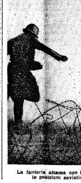
La fanteria attacca con lancio di bombe a mano le posizioni sovietiche.

Nell'Inghilterra meridionale apparecchi da caccia hanno affondato di giorno diversi impianti militari ed hanno abbattuto sul mare due apparecchi nemici. Due nostri velivoli sono andati perduti.