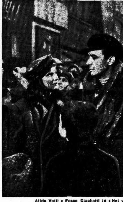
Alida Valli e Fosco Giachetti in «Noi vivi»

Il film è stato tratto, è famoso; è famoso è l'intreccio. L'opera di Ayn Rand è un documento imponente, se non un romanzo eccellente. Un documento di tanta esperienza, che riscatta gli stessi errori — quasi tutti di progettazione — che pesano sulla cinquantina pagine. Dove molti episodi potrebbero essere conclusi in una sintesi più solida; dove qualche pagina dovrebbe sorgere da un'analisi più forte; dove qualche racconto, di testi medesimi, ma riaccontare una trama — specie una trama cinematografica — non significa far «vedere» il film, ritrare la qualità morale e stilistica di un film. Anche perché un film non è — o non dovrebbe essere — un'opera scissa; e se, con il racconto dell'intreccio, la critica drammatica può già indovinare il tono del dialogo, ecco, per la critica pellicolaria, — siccome un altro è il linguaggio dello schermo — la necessità di una diversa forma espressiva. Tanto più che il critico drammatico è aiutato dallo stesso lettore, il quale ha la lingua pratica e non ignora, per esempio, il significato di «commedia inatimista» o di «dramma grandioso»; mentre il critico di cinema è costretto a uno scrivere che escluda le citazioni e i raffronti. Dietro, egli legge di un film è attento al nome degli interpreti; mentre il nome del regista è già di minor richiamo. E un discorso sulle immagini e sul dialogo delle immagini riuscirebbe, per chi legge, difficile o noioso.