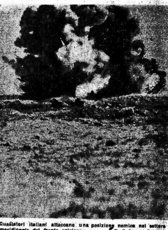
Guardatori italiani attaccano una posizione nemica nel settore meridionale del fronte egiziano

Località della Bulgaria bombardata da aerei nemici Sofia, 14 settembre Il Comando di Stato Maggiore comunica: «La notte scorsa apparecchi nemici di nazionalità sconosciuta hanno sorvolato il territorio della Bulgaria ed hanno gettato alcune bombe su località abitate e su obiettivi non militari. Si è avuto un certo numero di feriti tra la popolazione civile.»