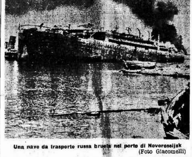
Una nave da trasporto russa bruciata nel porto di Novorossisk

Battaglioni americani di negri a Port Moresby per rinforzare le vacillanti truppe di Mac Arthur