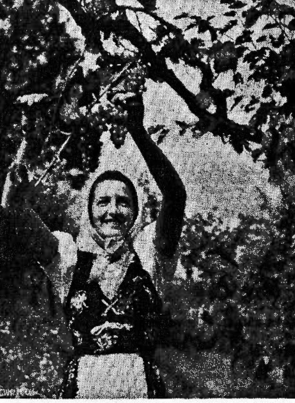
Settembre matura i grappoli dolci e la tavola del popolo si arricchisce di uva, il frutto che nutre ed ha un prezzo modesto. Mangiare uva, la buona e sana uva, è cosa quanto opportuna; per i bimbi, per gli adulti, questo prodotto tipicamente mediterraneo costituisce un sensibile concorso all'alimentazione in tempo di guerra, perchè assicura all'organismo preziosi elementi nutritivi.