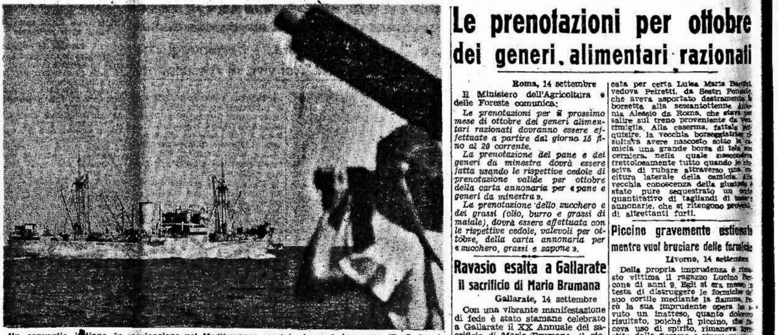
Un convegno italiano in navigazione nel Mediterraneo scortato da navi da guerra

Nel settore sud ovest le forze tedesche, composte di circa 3 divisioni corazzate e di 5 divisioni di fanteria tedesca e romena, attaccano ininterrottamente. Si svolge in questo settore un violento duello d'artiglieria e di mortai. Data la grande potenza di fuoco germanica, le perdite russe sono inevitabilmente gravi.