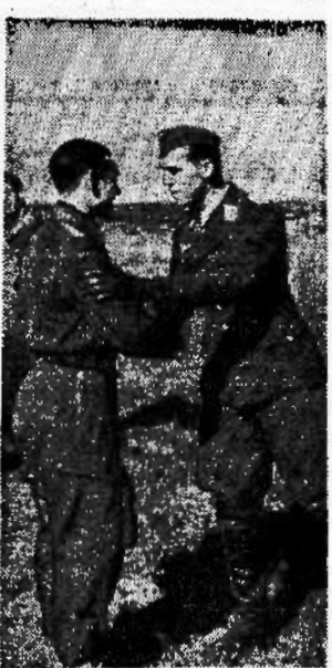
Cameraschico congratulazioni al maggiore tedesco Trautloff decorato in occasione della sua 33.a vittoria aerea

«Filone: Tale è stata la morte dei nostri beati, che, contemplando con sommo desiderio la bellezza divina, convertendo tutta l'anima in quella, abbandonano il corpo.