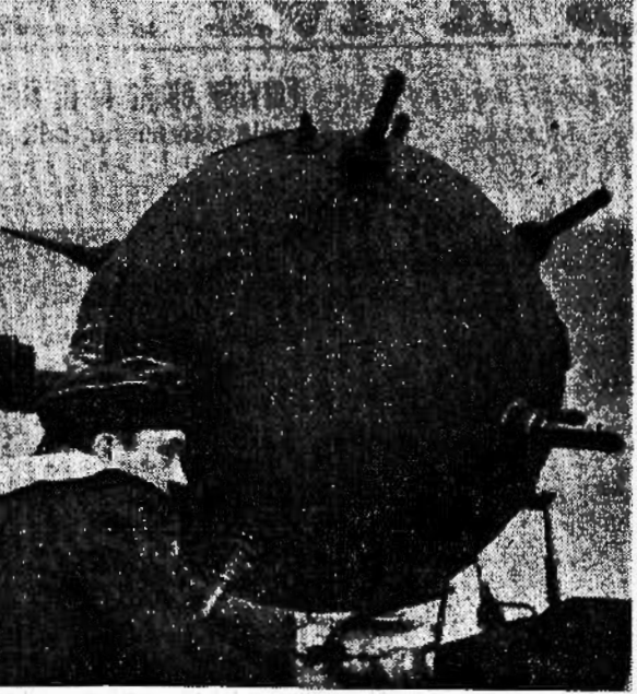
Migliaia e migliaia di mine vengono seminate dai tedeschi nelle acque che le navi nemiche devono percorrere.