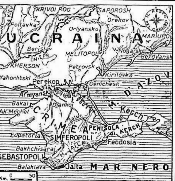
La portata dell'azione

L'offensiva nella penisola di Kerch si svolge secondo i piani prestabiliti. Da fonte tedesca si ritiene, come sempre, il massimo riserbo. Il bastione che i sovietici avevano eretto in quella stretta lingua di terra, nella speranza di sbarrare per sempre il passo alle truppe tedesche, venne sparato dai loro artigliatori già dal primo giorno dell'attacco.