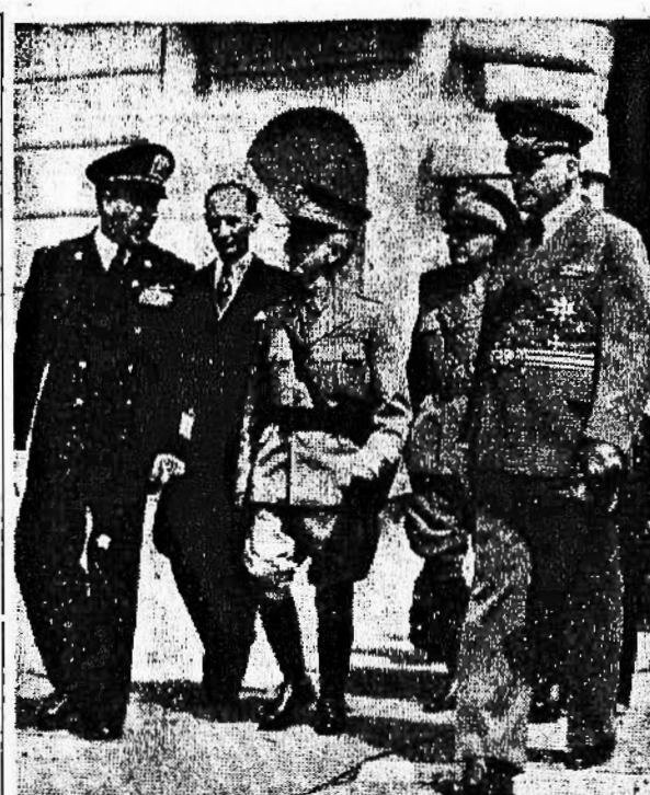
Il Re Inspettore ha inaugurato ieri l'esposizione annuale dell'Accademia italiana di Belle Arti. A Villa Massimo erano congregate numerose autorità politiche e personalità della cultura...