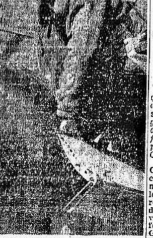
Dato dall'arma i nostri cacciatori partono per una azione contro il nemico sul Mediterraneo