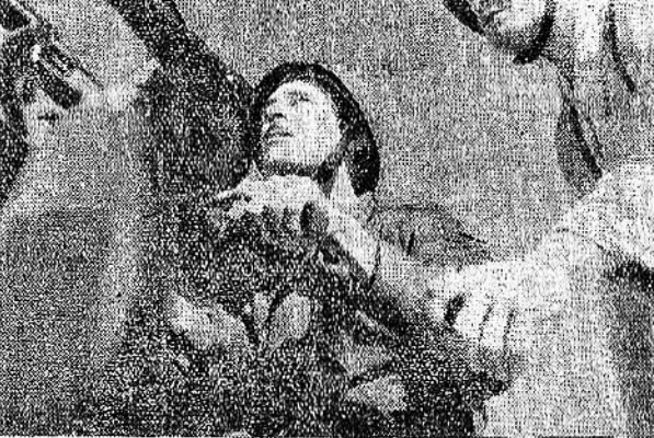
Difesa costiera e contrattacco della Marina: si punta la mitragliera contro velivoli nemici.

L'offerta della Principessa a Milano - Il successo di un concerto benefico a Roma