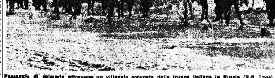
Passaggio di soldati attraverso un villaggio occupato dalle truppe italiane in Russia (R.D. Lugo).

LA RADIO. PRIMO PROGRAMMA: 12.30: Orchestra Camerata (M. G. B. S.); Musica sinfonica, 14.15: Concorso (M. G. B. S.); 17.10: Cella di Meo Basso, 19.40: Coro di voci maschili (M. G. B. S.); 21.30: Tre atti di Gino Rocca. SECONDO PROGRAMMA: 12.40: Concerto della pianista Margherita 13.15: Orchestre (M. G. B. S.); 14.20: Orchestra d'archi (M. G. B. S.); 15.30: Concerto sinfonico corale (M. G. B. S.).