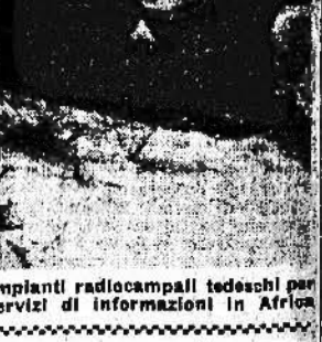
Impianti radiocampali tedeschi per servizi di informazioni in Africa

Il centro dell'Insulindia tempestato di bombe dagli aeroplani nipponici - Progressivo smantellamento delle difese americane a Bataan