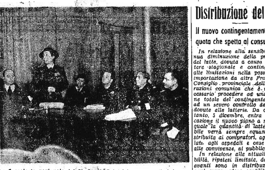
La segreteria nazionale del Sindacato Ostetriche espone alle intervenute i problemi della categoria.

La festa di Santa Barbara celebrata dai vigili del fuoco Martedì, in occasione della festa di Santa Barbara, patrona degli artigiani, le Caserme di Vigili del fuoco, sono state celebrate la Caserma di S. Ignazio e la Caserma di S. Agostino.