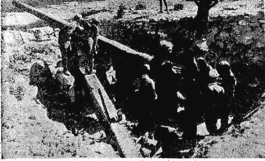
capturato dalle truppe dell'Asse presso Bardia