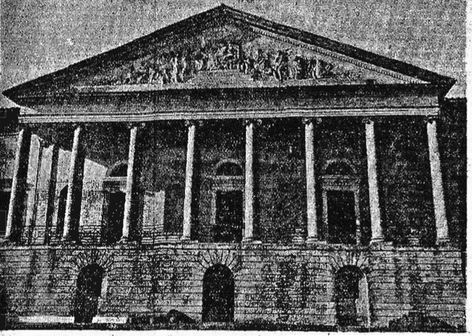
L'aspetto monumentale della Villa Aldini, dove sorgerà il sanatorio dei Caduti in guerra

La nuova Casa di Riposo per le famiglie dei Morti per la Patria