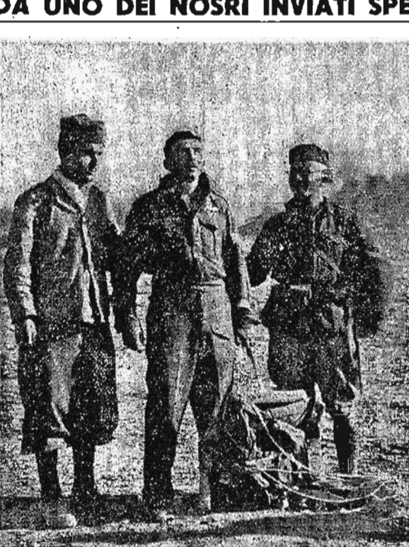
Pilota d'un apparecchio britannico abbattuto in Marmarica dalla nostra contraerea, viene catturato non appena ha toccato terra col paracadute. Sul fondo l'aereo in fiamme.

Mentre scriviamo la battaglia è sempre accesa e la sua definizione ancora lontana. Le forze ed i fronti si spostano, talora si riuocano con una rapidità che finirà per sembrare sconosciuta agli stessi teorici della guerra. Il momento, il possesso del territorio importa e non importa. Per le due parti contrapposte l'obiettivo essenziale è la distruzione delle forze avversarie. Oltre la portata dei canoni il deserto marino non apprende nessuno. Questa battaglia terrestre - di gran lunga la più grande e la più dura che questo continente abbia mai visto - ha in sostanza la fisionomia di una immensa battaglia navale.