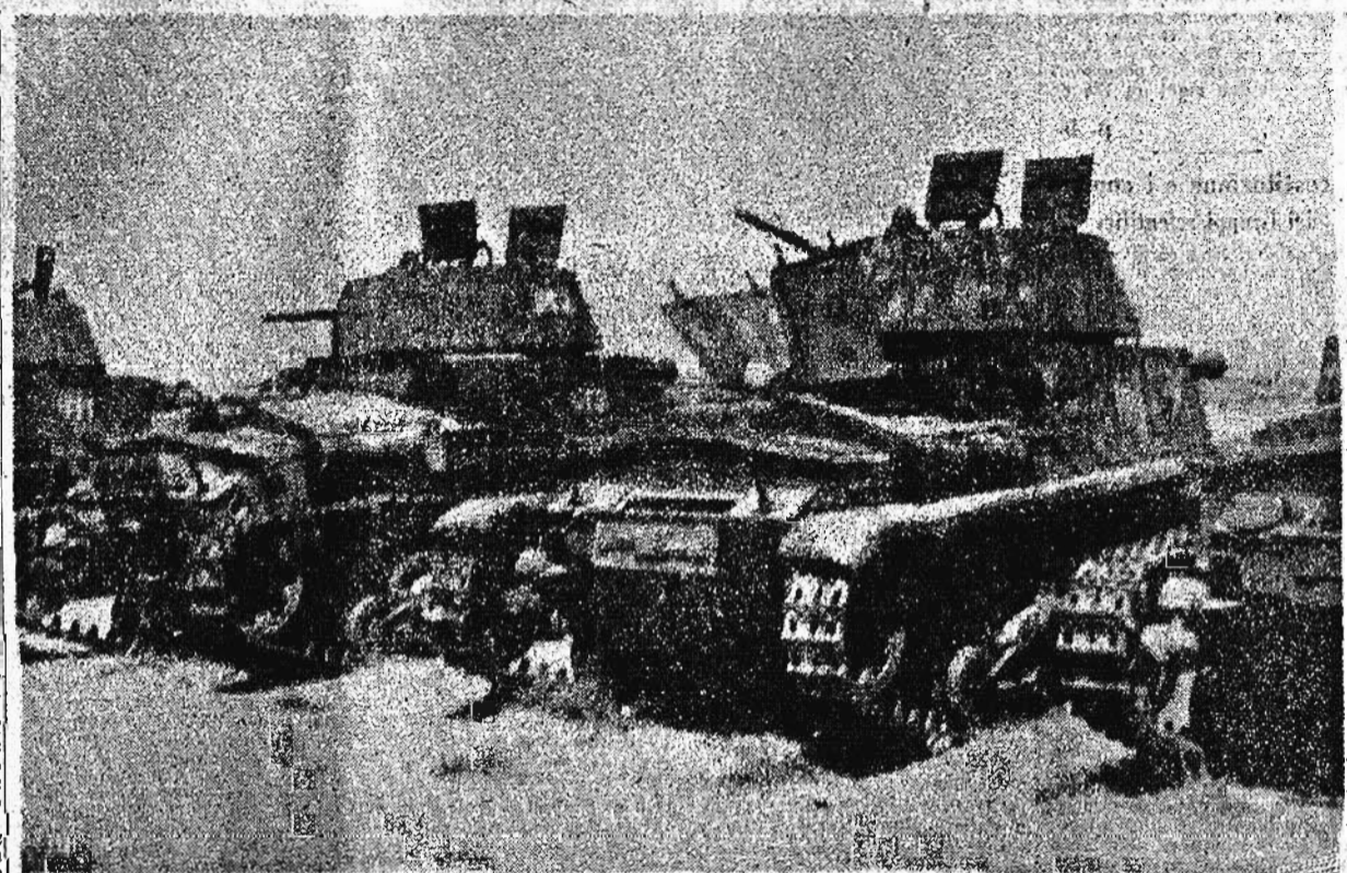
Mezzi corazzati inglesi catturati sul fronte della Marmarica

La nuova rotazione imposta di Marini, Coi e Strani (Nostra servizio parlatore) Roma, 2 dicembre Un ricognitore tedesco nella mattinata di ieri aveva segnalato la presenza di navi avversarie nei pressi di Tobruk. Una pattuglia di aerosiluranti nazionali si è inoltrata verso la base per raggiungere le unità nemiche attaccate. La pattuglia era comandata dal capitano pilota Giulio Marini, che nello scorcio dell'attacco è colpito con due siluri. Due "incrociatori" avversari, comandati da altri velivoli di appartenenza, Coi e Strani, si sono presentati. Il sottotenente Strani, ha segnalato questo ultimo da un nostro bollettino per avere il "catturato" il 25 ottobre scorso un incrociatore.