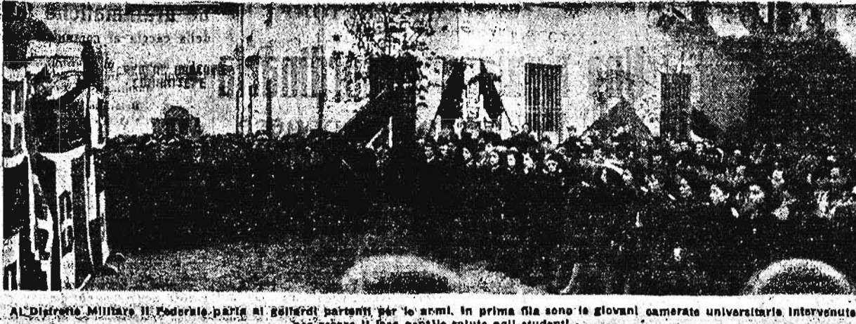
Al Distretto Militare il Federale parla ai genitori parenti per le armi, in prima fila sono i giovani camerati universitari intervenuti per reprimere il loro gentile saluto agli studenti.

Fisarmoniche - Radio Pianoforti, musica, toni, dischi da BORSARI SARTI, Farini 7. Noleggio, cambi, riparazioni.