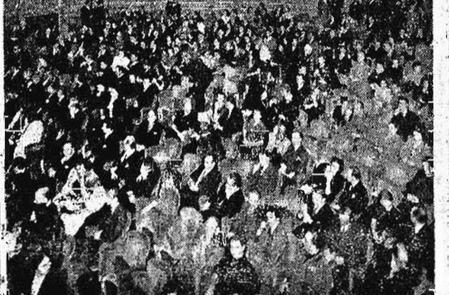
La serata celebrativa di Mozart alla «Fenice» di Venezia con l'esecuzione del «Ratto del serraglio»