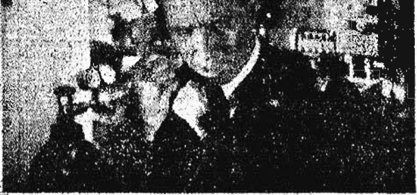
Una scena della "Nave bianca" di Roberto Rossellini

Qualche giorno dopo il dott. Koeran annunciava ai giornali di avere scoperto una giovane di 22 anni, onesta, bene allevata, intelligente, eccellente stenodattilografa più cercava un posto di segretaria. Il dottore pregava persone che desideravano avere una collaboratrice così perfetta, di farsi conoscere. Parecchie decine di commercianti, industriali, avvocati offrivano un impiego alla giovane, ma quando la postulante si presentava, tutti, uno dopo l'altro, le rimandavano. La perfetta segretaria era finalmente un mostro.