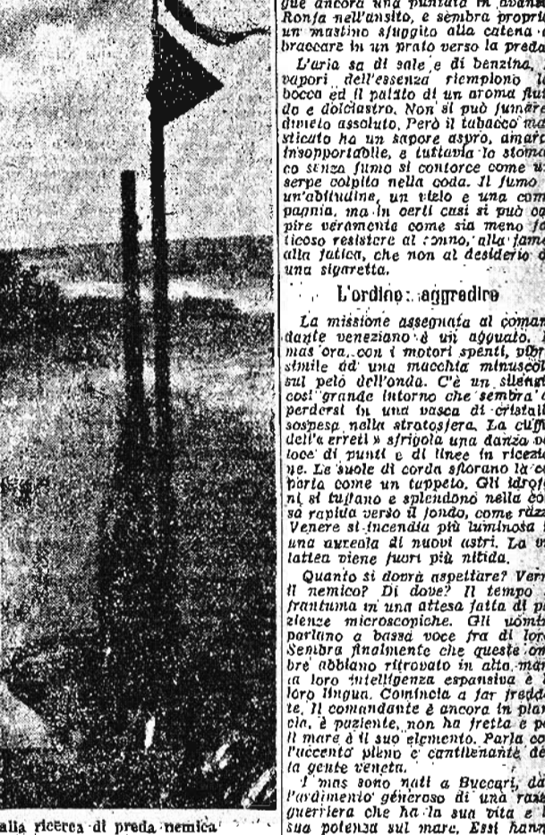
Mas italiani in partenza alla ricerca di preda nemica

Da una base navale, 15 settembre C'è vento di nord, aria di uragano. Il mare è irrequieto, rolla in bracciate larghe e si getta a capofitto contro i moli; contro le scogliere di roccia e di alghe. Sagomate scure sfumano su un orizzonte tuffato e macchiato. Un convoglio? Forse. La mia finestra è aperta incontro al buio. Sono aperte anche le finestre del mio appartamento, un ricordo di fumo, di catrame, di pesce. L'odore inconfondibile di un porto congestionato. Tutti così, con la stessa atmosfera asfissiante e pesante, balsamica e tossica; così nei vestimenti, nei caruggi gonfiati, nelle colmate artificiali di Lioorno, nei basti di Napoli. Il "raspiro della guerra". Quando mi sono perduto quaggiù in questo sereno di vicoli, di muri carichi, di negozi opachi, mi è sembrato di trovarmi in una città nuova, sconosciuta. E chissà perché in questa atmosfera, dove le ombre giocano, raccolte, come fiere in agguato incontro alla luce del crepuscolo e delle prime lampade, ho sentito il respiro della guerra più grave e più vicino.