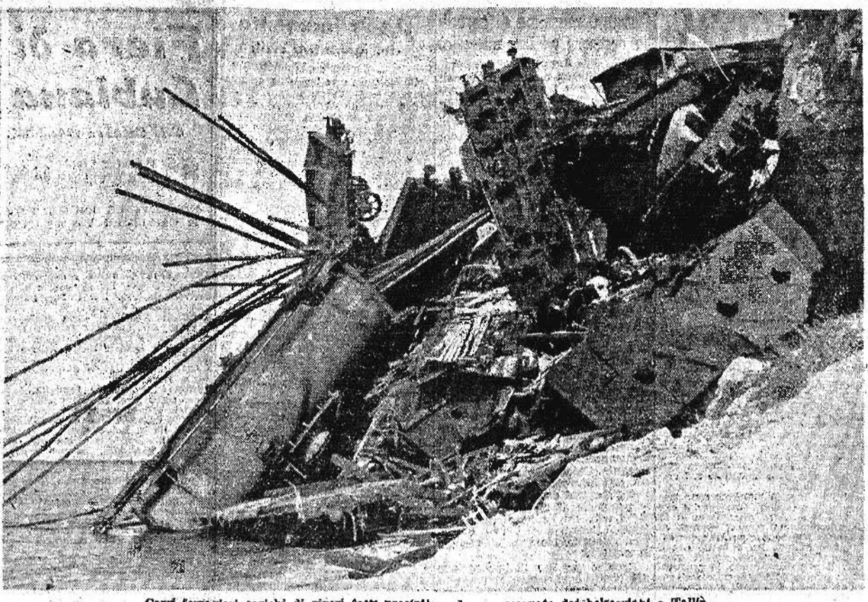
Carrì ferroviari carichi di viveri fatti precipitare da una scarpata dai bolscevichi a Tallin