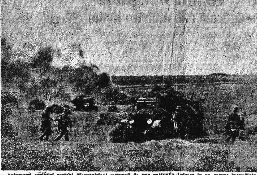
Automezzi sovietici carichi di munizioni catturati da una pattuglia tedesca in un campo incendiato.

Un corpo di artiglieria contraria, impegnato nei combattimenti sul settore meridionale nel periodo di tempo che va dal 15 settembre, ha complessivamente abbattuto 215 aerei sovietici, e distrutto 51 fortini - tra cui parecchie opere potentissime corazzate - e 345 carri armati, 179 cannoni e 486 nidi di mitragliera.