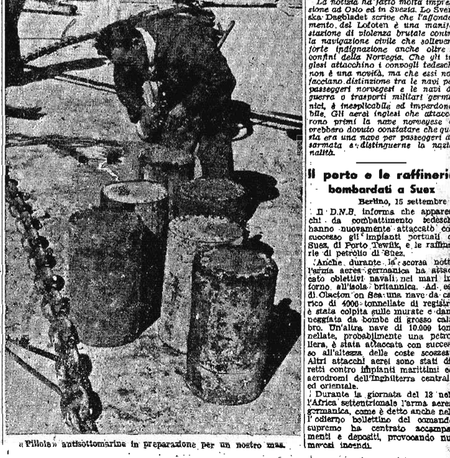
«Pillola» antisottomarina in preparazione per un nostro mas.