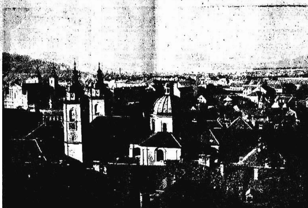
Una veduta della bella città slovena entrata con la sua regione a far parte del Regno d'Italia