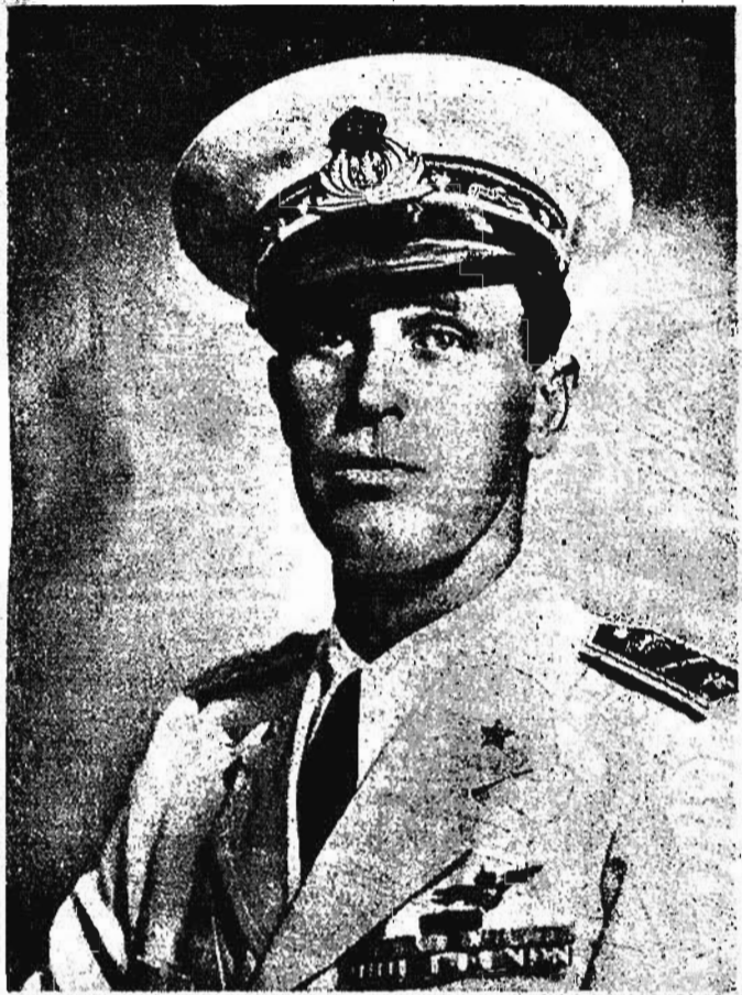
Amedeo di Savoia Duca d'Aosta, indomito difensore delle terre imperiali...