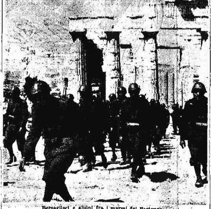
Bersaglieri e alpini fra i marmi del Partenone