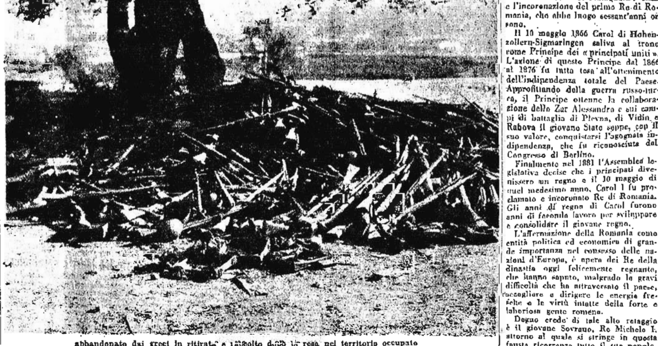
abbandonato dai greci in ritirata, è rimasto dopo la resa nel territorio occupato

Vertical text on the far left edge of the page, partially obscured.