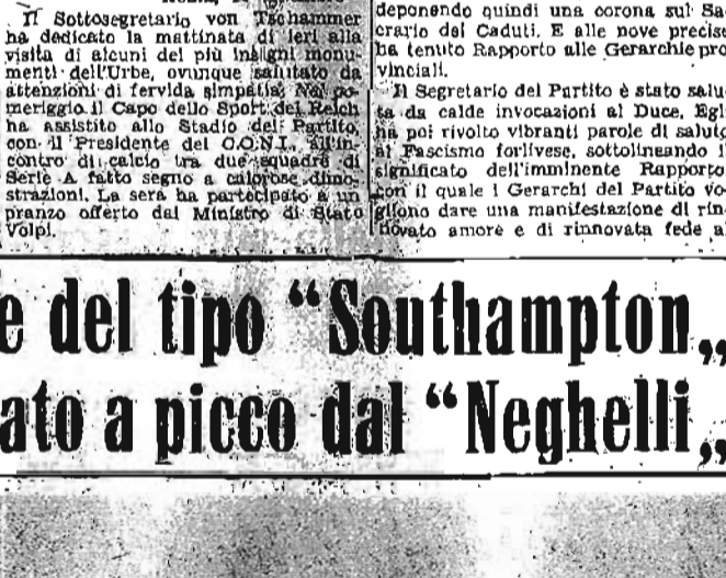
La unità inglese affondata

Ecco le caratteristiche degli incrociatori britannici del tipo "Southampton", uno dei quali è stato affondato dal sommergibile Neghelli. Al tipo "Southampton" appartenevano, all'istinto delle ostilità, dieci unità di una stazza da 9 a 10 mila tonnellate. Essi sono di recente costruzione, in quanto varate tra il 1934 e 1937. Il loro armamento si compone di: 12 cannoni da 165 mm. in quattro torrette triinate, 8 cannoni antiaerei da 102 mm. in torri binate, quattro cannoni antiaerei da 47 mm., 18 mitragliatrici da 30 mm. da 8 mm. e 8 torri lanciavivande da 53 mm. in due impianti triinati, una catapulta con tre carrelli. Il loro apparato motore è di 75 mila cavalli sviluppo, una velocità di nodi 37,5. La cozza verticale ha lo spessore di 127 mm. e quella orizzontale di 55 mm. Gli incrociatori di tale tipo hanno una lunghezza di 178 metri. L'equipaggio è composto di 700 uomini.