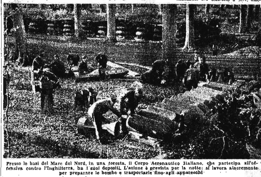
Presso le basi del Mare del Nord, in una foresta, il Corpo Aeronautico Italiano, che partecipa all'offensiva contro l'Inghilterra, ha i suoi depositi. L'azione è prevista per la notte: si lavora alacremente per preparare le bombe e trasportarle fino agli apparecchi.