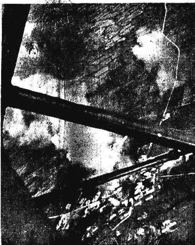
Sul fronte greco-albanese, i "picchiatori" hanno attaccato i depositi di carburante di Eriba. La fotografia, ripresa subito dopo il lancio delle bombe, dimostra la precisione con la quale sono stati centrati gli obiettivi

Durante un tentato attacco nemico su Valona, il giorno 18, sono stati abbattuti dalla nostra caccia tre apparecchi "Blenheim". In Africa Orientale, al confine sudanese, attività di pattuglie e di artiglieria. Nella giornata del 19 sono stati colpiti i depositi e gli apparecchi difensivi nemici nei pressi di Melemna. Nostri aerei, il giorno 18 hanno bombardato e spezzonato truppe a nord della stazione di Eriba, e il bivio ferroviario di Halya-Junction, centrandolo.