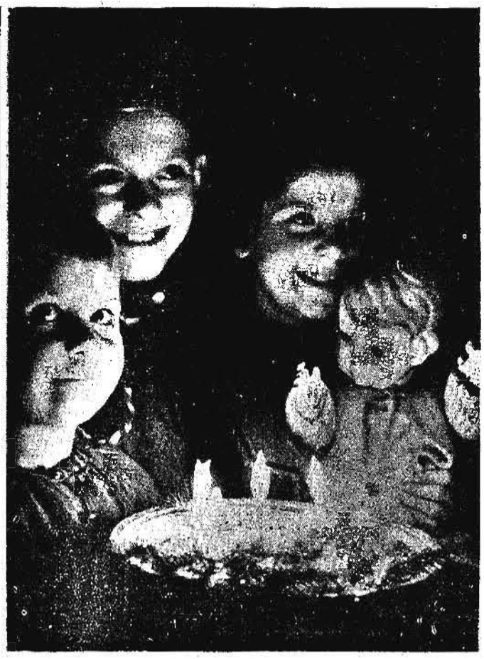
Gli occhi si spalancano e i bimbi sorridono nella calda atmosfera della famiglia.

Lo stato d'assedio prorogato in Turchia. Ankara, 20 dicembre. Il Governo turco ha presentato alla Camera un progetto di legge per prorogare la proroga dello stato d'assedio per le zone in cui esso è attualmente in vigore. La proroga demandata ha una durata di tre mesi. Il Governo ha deciso di istituire il monopolio di stato per la vendita dell'olio di oliva e del tabacco. Intanto sono state riprese alcune transazioni commerciali all'estero. Infatti a Smirne è stato realizzato un accordo per la vendita alla Germania di merci per 600 mila lire turche. L'Inghilterra compra 10 mila tonnellate di olio di oliva mentre un altro accordo stabilisce la vendita alla Lettonia di una certa quantità di uva secca.