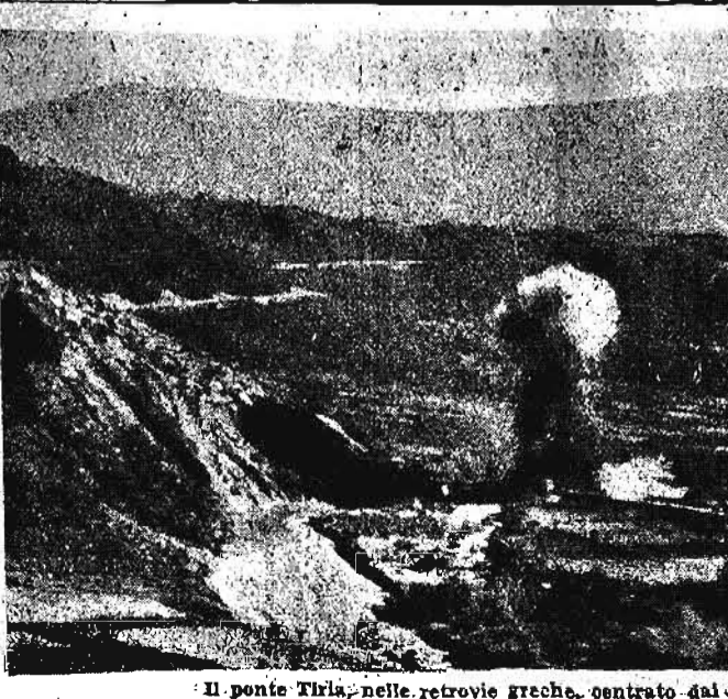
Il ponte Tirla, nelle retrovie greche, centrato dai nostri bombardieri.

Il bilancio di questa sua ultima giornata si chiude per noi con la perdita di tre bombardieri e di tre caccia, mentre per l'avversario si sintetizza in nove caccia abbattuti in combattimento aereo, in quattro apparecchi distrutti sicuramente al suolo, e dieci costrutti probabilmente distrutti al suolo.