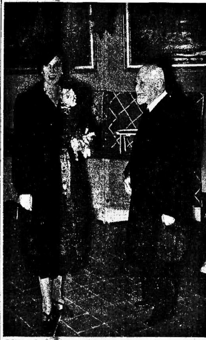
ROMA - La Principessa di Piemonte visita la Mostra del Ricamo della Scuola di Macconigi a Palazzo Tavernani. E' al suo fianco il Principe Chigi-Albani.