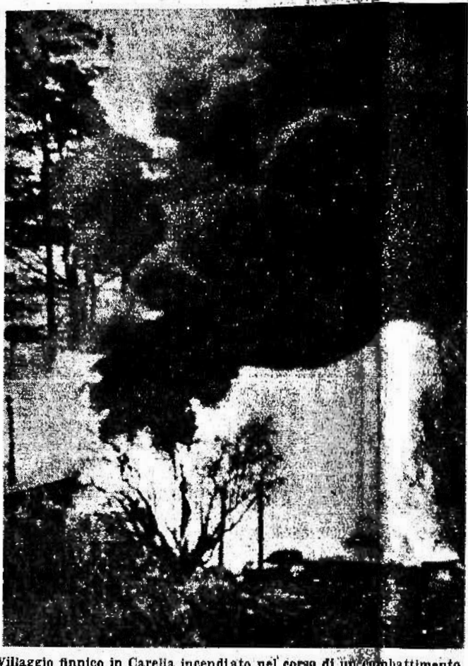
Villaggio finnico in Carelia incendiato nel corso di un combattimento