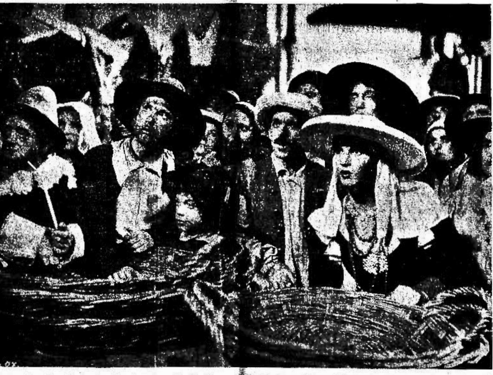
Luisa Ferida, Umberto Sacripante e Paolo Stoppa in «Un'avventura di Salvator Rosa»...

I fabbricanti ad ogni tentativo insolitamente oppongono l'escrabiabile gusto del pubblico. Il gusto del pubblico riduce oggi il cinema-dramma a una industria più o meno grossolana in concorrenza col teatro. Io stesso - per quella famosa carne rossa che deve eccitare il coraggio dei miei cani corsari - ho lasciato incischiare in film alcuni dei miei drammi più poetici.