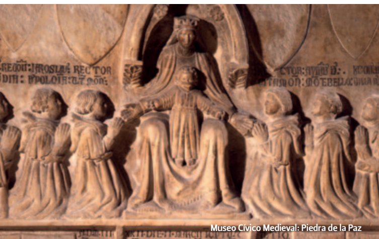
Museo Cívico Medieval: Piedra de la Paz

El Museo conserva la escultura denominada Piedra de la Paz (Sala 9) que representa a la Virgen con el Niño que acoge simbólicamente a dos filas de estudiantes arrodillados a sus pies. La escultura, obra del Maestro Corrado Fogolini y realizada en 1322, fue concebida para establecer la paz entre el Ayuntamiento y los estudiantes tras las protestas que siguieron a la captura y la decapitación de uno de ellos, el español Jacopo da Valenza, acusado de haber raptado a Constanza, una joven de la que se había enamorado. En la Sala I encontramos algunas piezas de mayólica de Manises de los siglos XV–XVI, un tipo de cerámica que se caracteriza por un particular estilo decorativo con efectos iridiscentes, atribuible a la producción de los ceramistas que trabajaban en la península ibérica durante el dominio árabe. www.museibologna.it/artantica