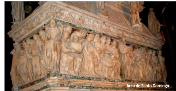
Arca de Santo Domingo

En 1216 el papa Honorio III aprobó la regla de la orden fundada por Domingo de Guzmán, que creció hasta enviar monjes a los principales centros europeos, entre ellos Bolonia, ciudad populosa y prestigiosa sede universitaria. Domingo llegó a Bolonia en 1218 y se alojó en la “Mascarella”, iglesia y hospedería de los canónigos regulares de Roncesvalles fuera de las murallas. La iglesia, reconstruida luego de los bombardeos de la segunda guerra mundial como edificio moderno, está decorada con un notable pórtico. De aquella época se conserva solo la fachada del antiguo oratorio. En su interior obras de la escuela de Reni, de Bartolomeo Passerotti, de Simone dei Crocefissi y una mesa del siglo XIII, la misma alrededor de la cual se sentaban a comer los dominicanos de la Mascarella y donde aparece retratado Santo Domingo.