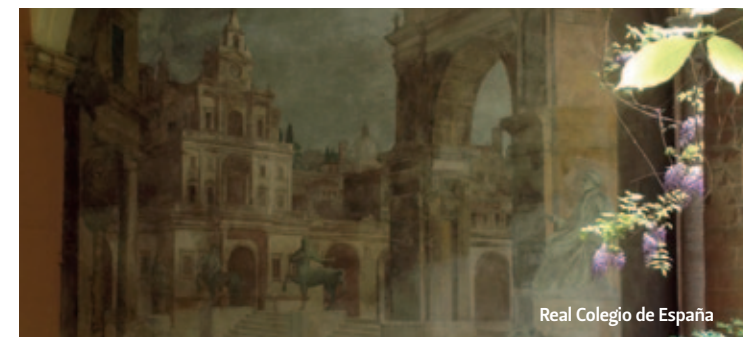
Real Colegio de España

La decoración mural del palacio del Archiginnasio, sede del Studium boloñés entre 1563 y 1803, representa un patrimonio fascinante. Están representados más de 6.000 escudos de armas, de los cuales una veintena pertenecen a estudiantes de origen español.