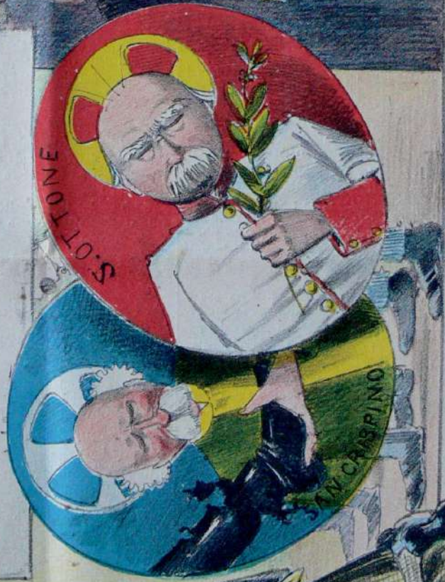
S. Crispino v. m. protettore d'Italia e delle vergini. — Cerca di accomodare lo Stivale con cuciture e pezzi poco solide. Sant' Ottone di... ferro, protettore della Pace armata, per la quale e per stare in pace è necessario essere in guerra.