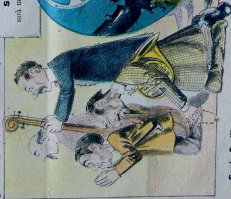
Santa Cecilia accoglie fra le sue braccia pietose i musicisti affamati in cerca di scritte per prosimo inverno.