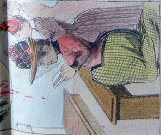
Sant' Anna protettrice delle donne che seguono il detto evangelico: Crescite e moltiplicate.