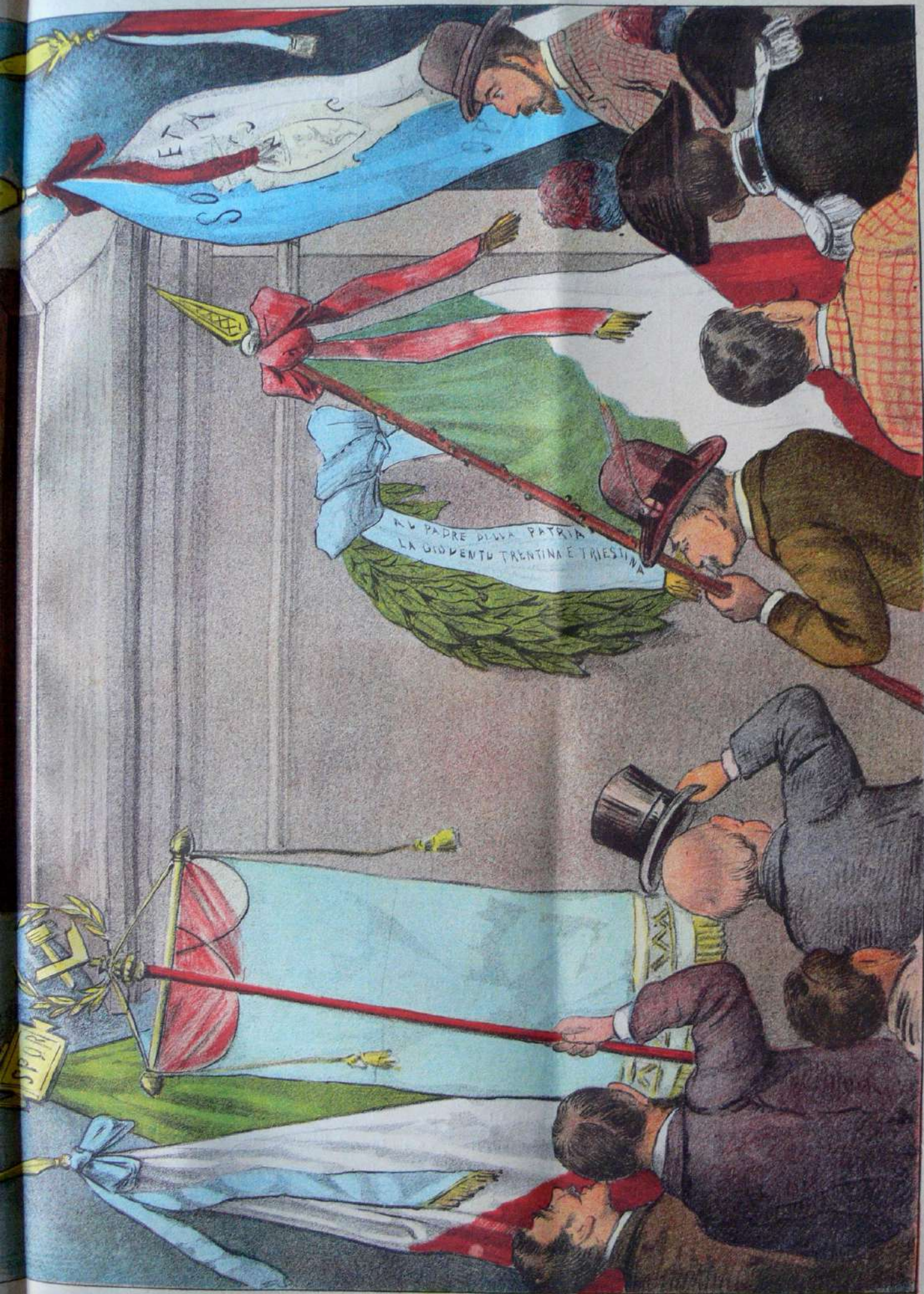
Inaugurazione del Monumento a VITTORIO EMANUELE. Riconoscenza dei presenti al PADRE DELLA PATRIA, aspirazione dei lontani di entrare in famiglia.