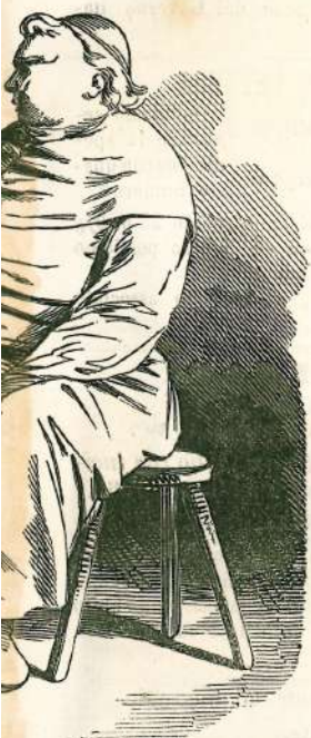
dan...den...don! — Oh, ha detto il Re in Par- resa una virtù agevole