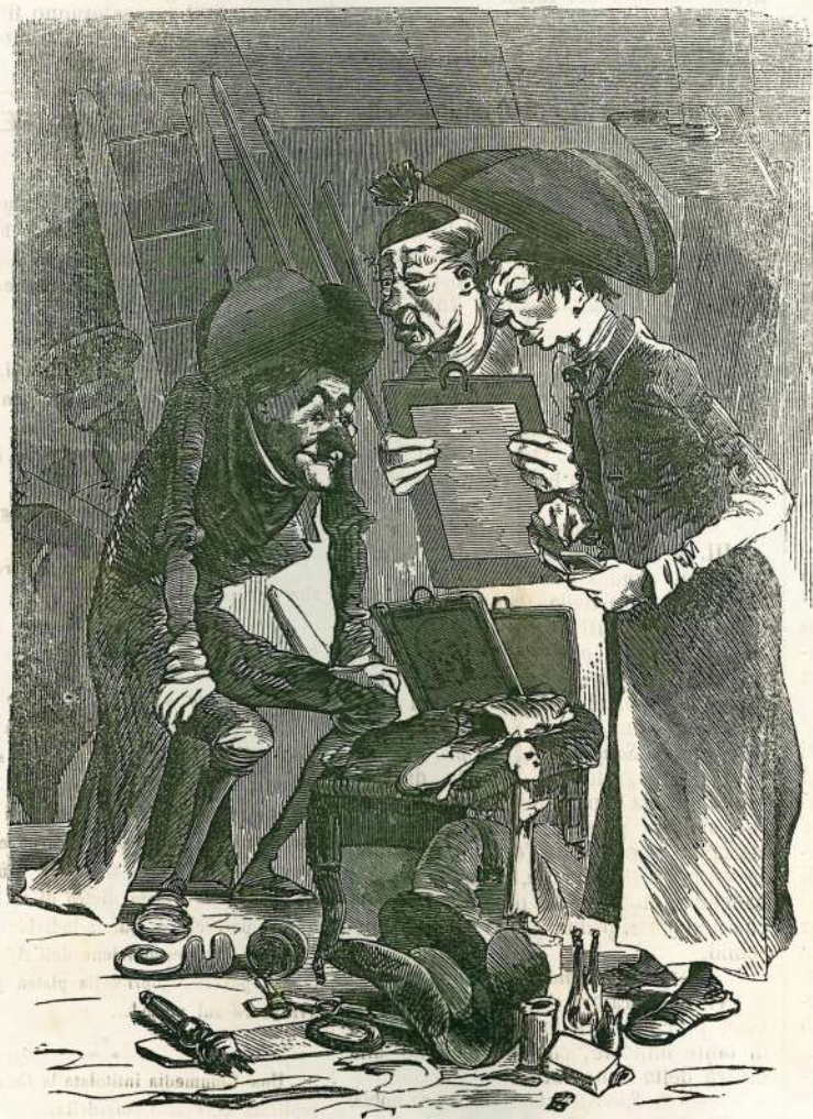
...Cosa ne dite voi altri?... Venderemo la nostra roba, prima d'essere soppressi: non è vero? Vendiamola pure. D. Liborio: ma bella grazia se di questa si cava da bere un quintino! ...