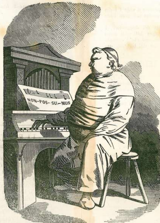
Non pos...su...mus, den...dan...den...don! — Oh, è proprio vero quello che ha detto il Re in Parlamento » che l'aspettare è resa una virtù agevole » all' Italia!