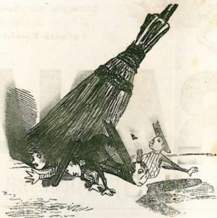
Effetti della soppressione delle porco-razioni religiosi.