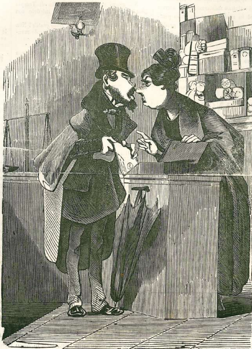
— Il discorso di S. M. parla chiaro » Vi raccomando di ripartire gli o- » neri nel modo il men gravoso ed il più equo possibile »... Potrebbe dun- » que darsi che i zigari diminuissero d'un centesimo? — Chi lo sa... la loro qualità meriterebbe altro'...