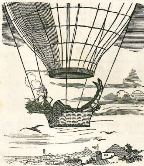
Profezia della Rana per l'Impresario del Teatro Comunale di Bologna, se continuano le indisposizioni.