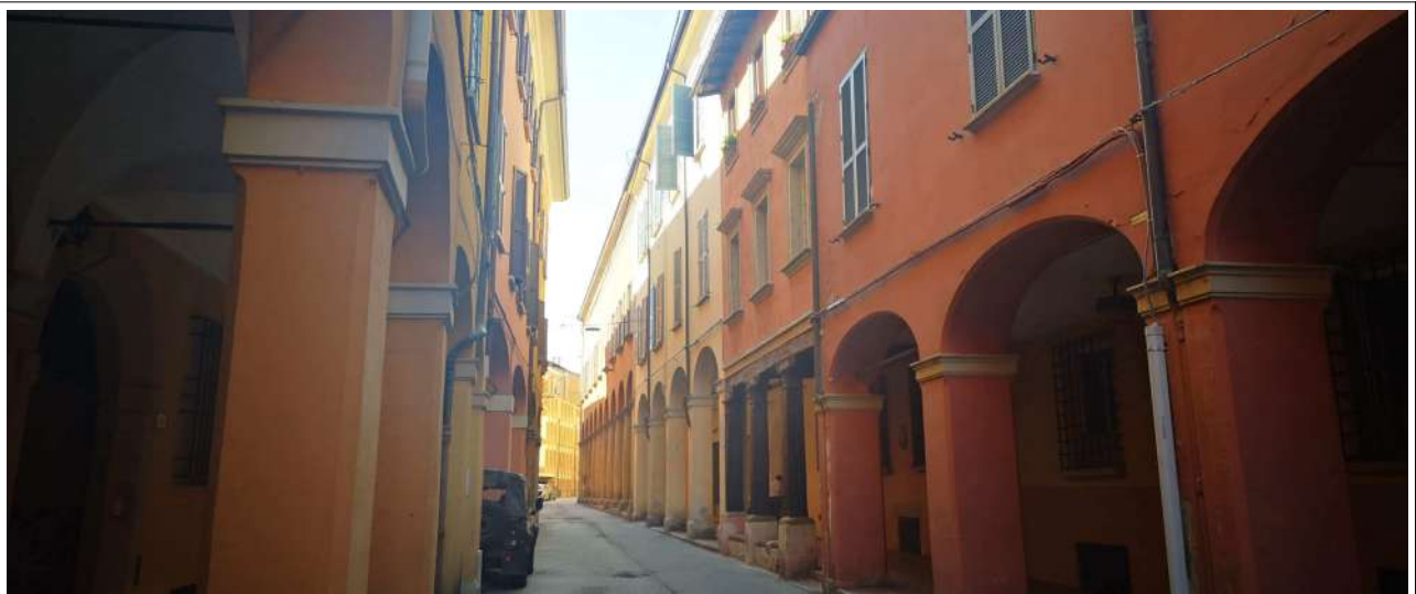
VISTA DI VIA DE GOMBRUTI