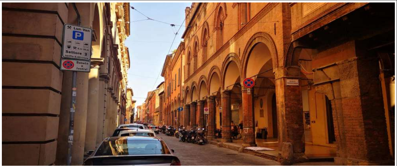
VISTA DI STADA MAGGIORE