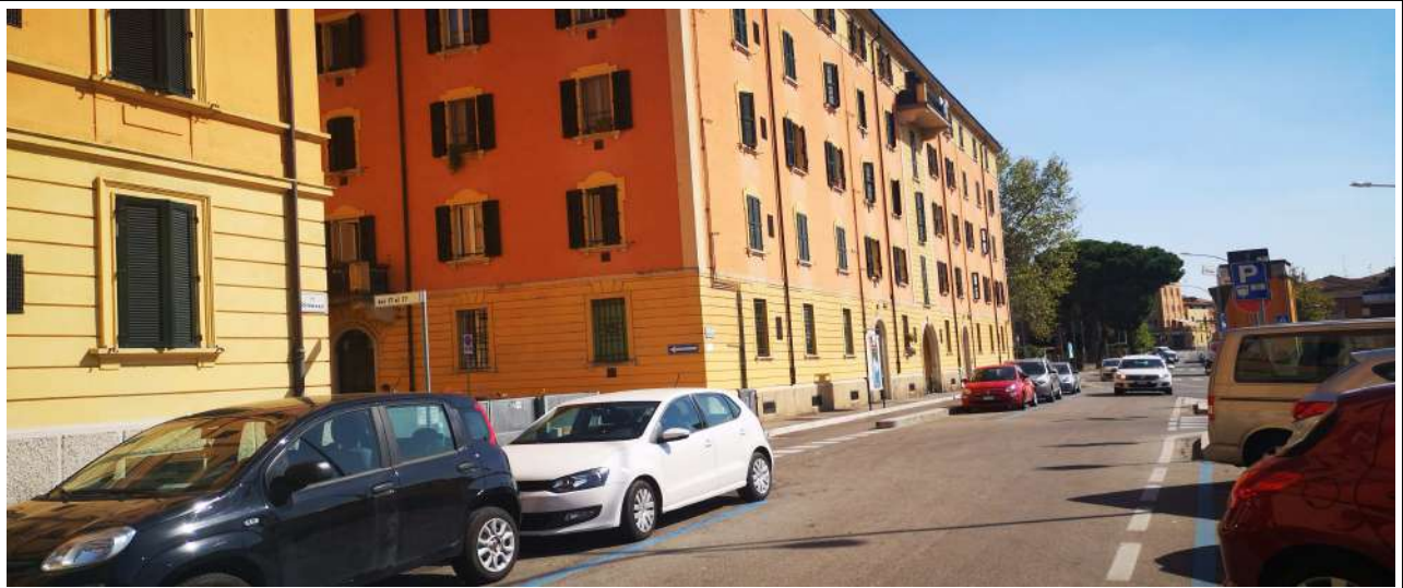
VISTA DI VIA RIMESSE