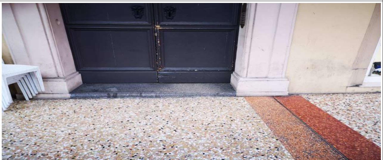
PAVIMENTAZIONE DI STADA MAGGIORE 13 - (PROPRIETÀ PRIVATA A DI USO PUBBLICO)