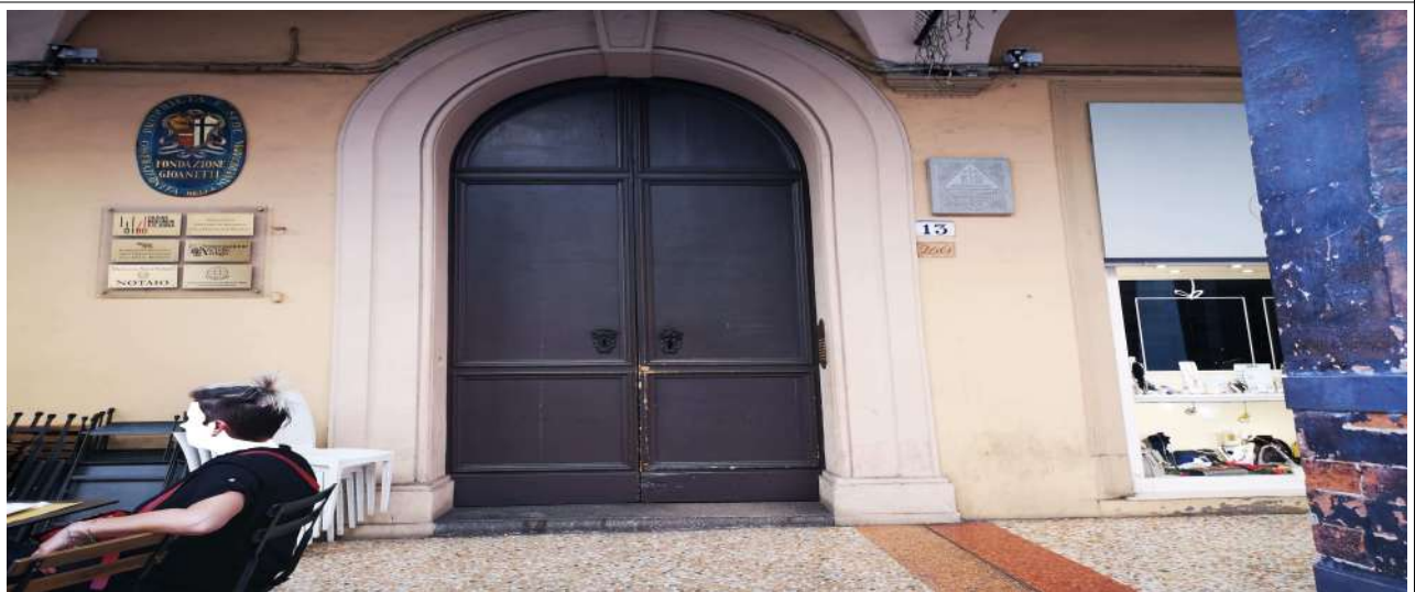
INGRESSO DI STADA MAGGIORE 13