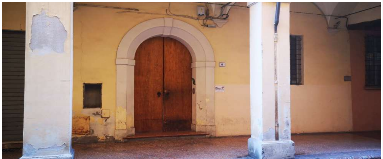
INGRESSO VIA DE GOMBRUTI 9