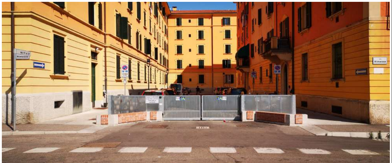
INGRESSO VIA RIMESSE 25