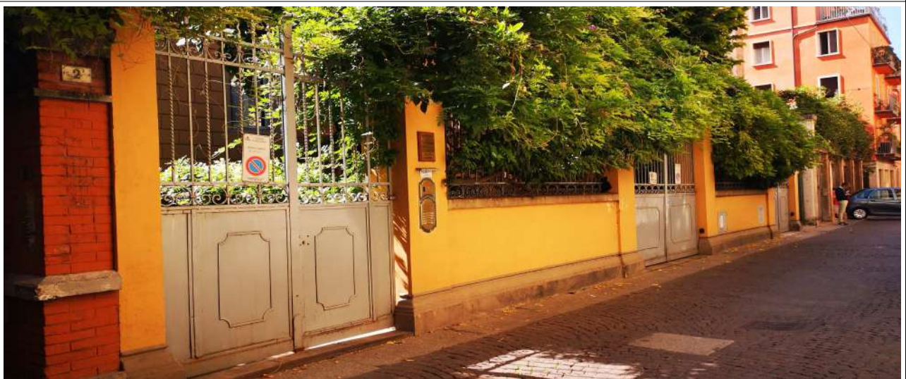
INGRESSO VIA DEL CESTELLO 4