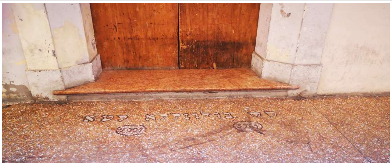
PAVIMENTAZIONE VIA DE GOMBRUTI 9 - (PROPRIETÀ PRIVATA A DI USO PUBBLICO)