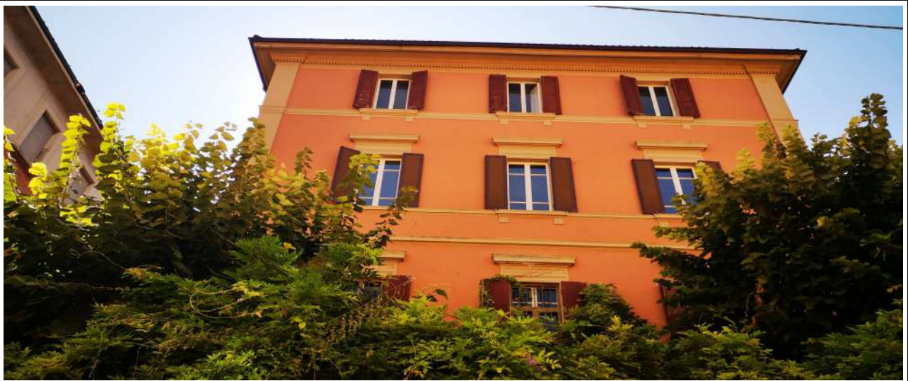
VISTA DI VIA DEL CESTELLO