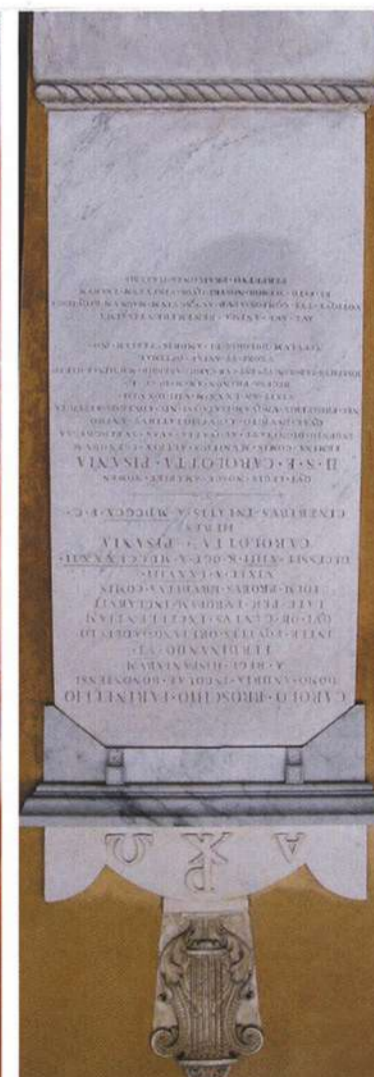
TOMBA DI CARLO BROSCHI DETTO IL FARINELLI