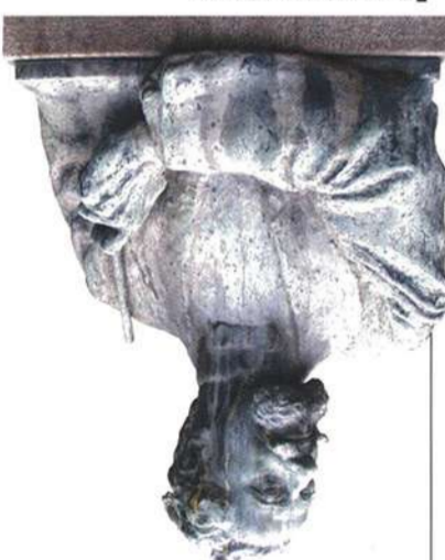
BUSTO DI RODOLFO FERRARI