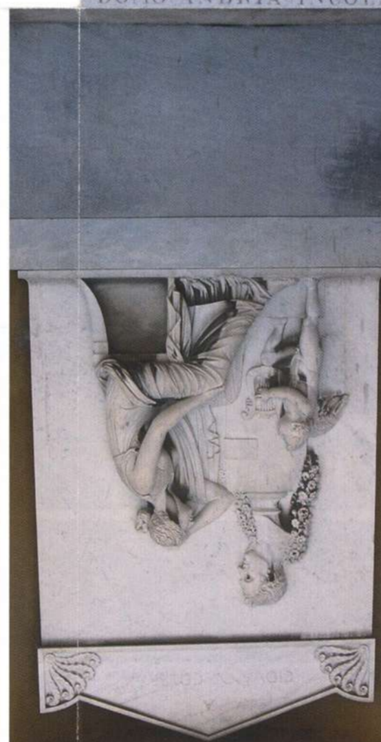
TOMBA COLBRAN - ROSSINI