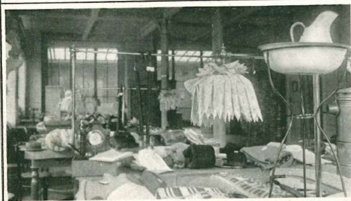
Esposizione dei regali utili.