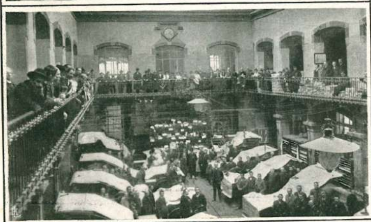
Il Salone delle macchine durante l'estrazione delle lotterie gastronomiche.