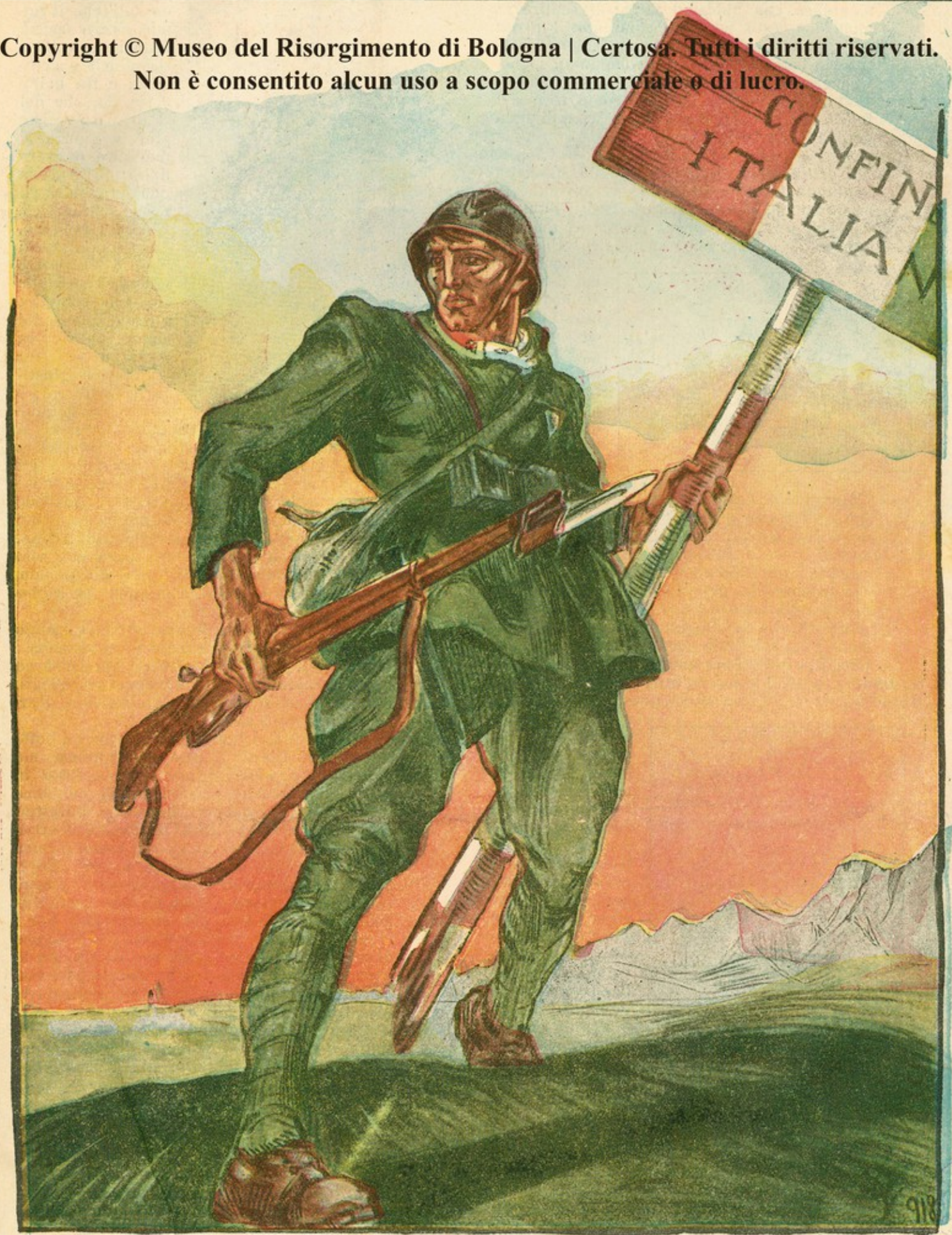
SOLDATO DELLA VITTORIA, L'ITALIA TI RINGRAZIA.