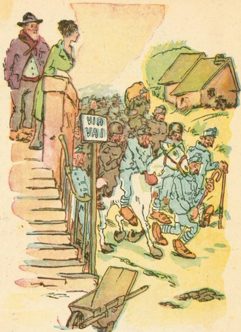
— Saluti a casa!