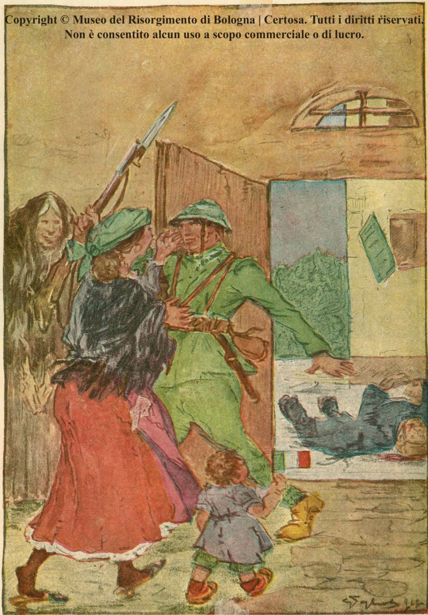
IL RITORNO DEL SOLDATO FRIULANO.

Copyright © Museo del Risorgimento di Bologna | Certosa. Tutti i diritti riservati. Non è consentito alcun uso a scopo commerciale o di lucro.