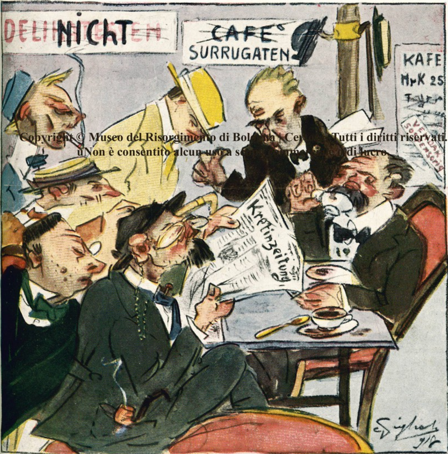
Disegno del Sold. GIGLIOLI