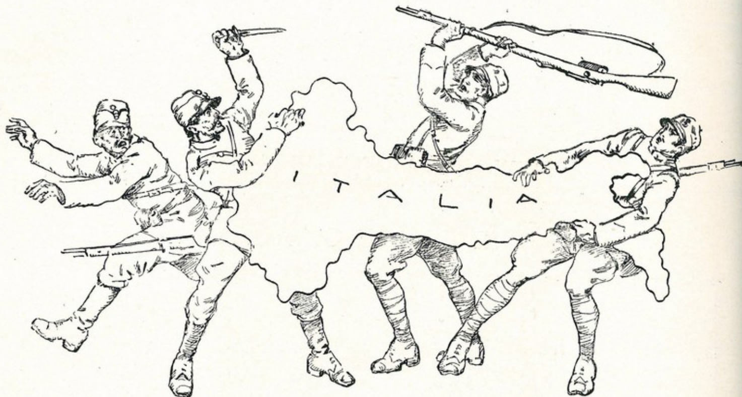
Francia, Zona di Guerra li 20-7-18.