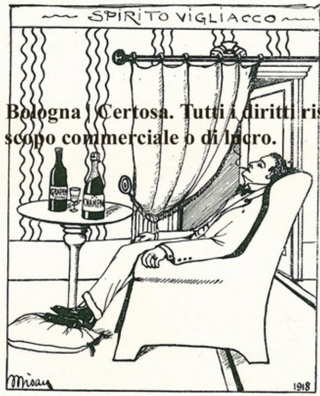
L'imboscato: Non mi so proprio decidere! Grappa o Champagne?!