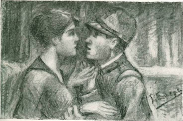
Lei: Ti sarò fedele, come tu alla Patria.