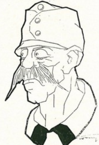
— Se non prendevamo l'offensiva eravamo rovinati! — Sì, ora che l'abbiamo presa siamo f....