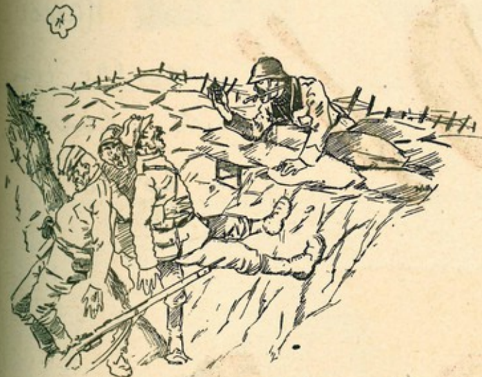
Fronte francese: giugno 1918

L'ARDITO: Ohè amici, di qui bisogna sgombrare