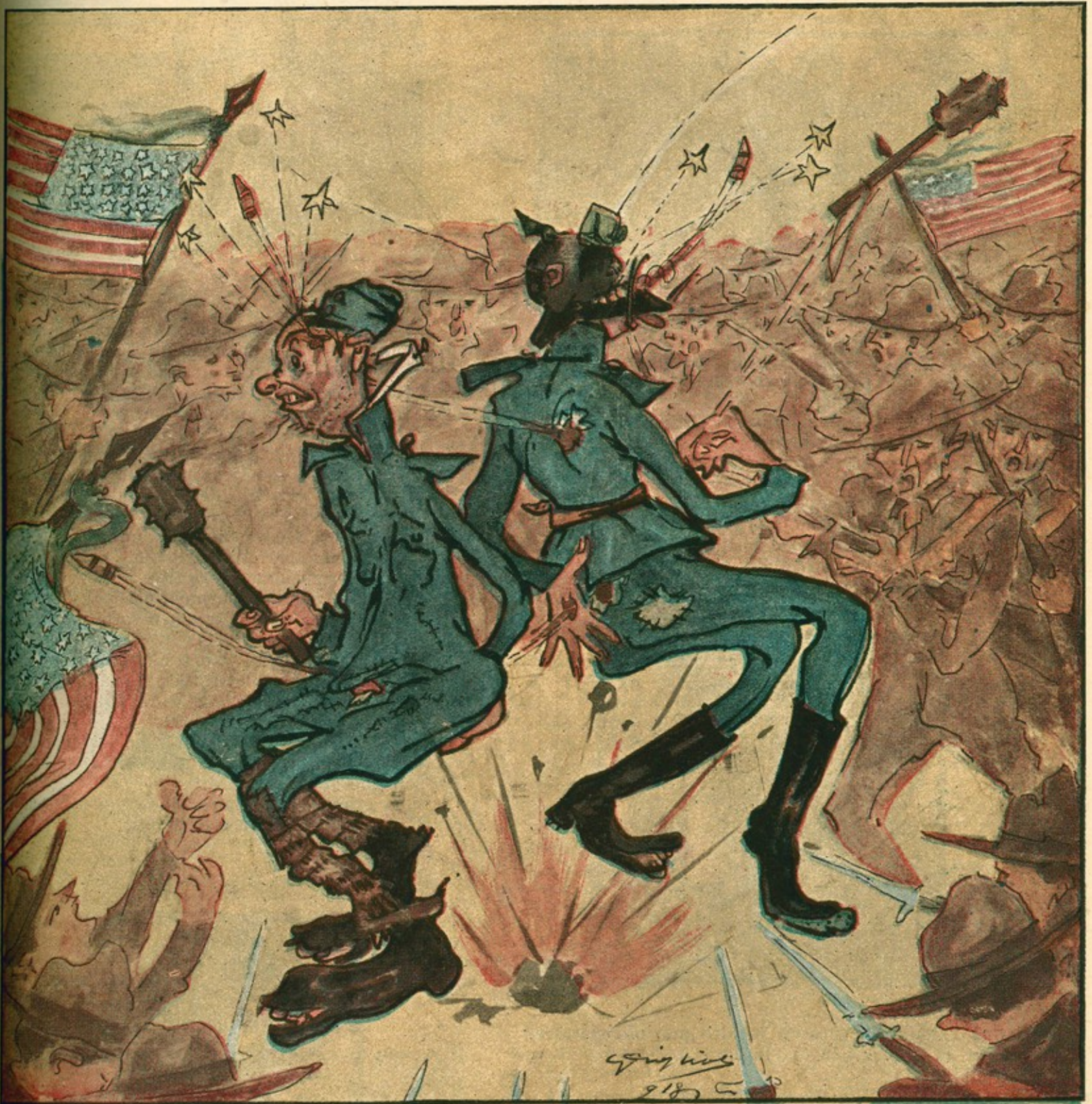
Disegno del Sold. GIGLIOLI

— Da qualunque parte ci si volti, si vedono le stelle.