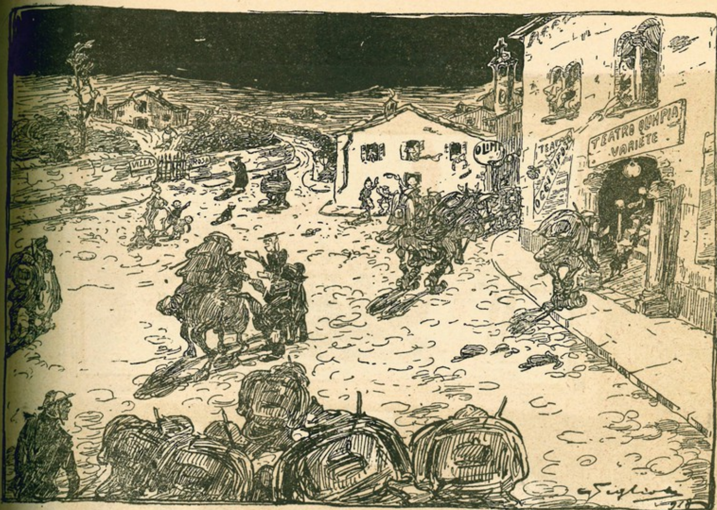
La partenza per la prima linea.