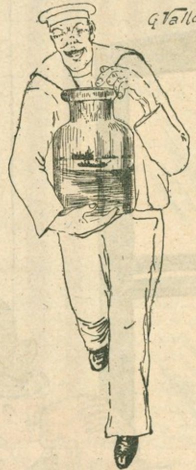
La flotta tedesca di Zeebrugge al sicuro