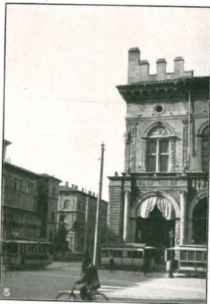
FINESTRA A CROCIERA PER LA FACCIATA DEL PODESTÀ.

Il Podestà, tuttora, dopo i restauri del 1887, in cui si riaprirono i grandi finestroni, ridotti, per mezzo di ammattonati, a più modeste, ma sconcie aperture, e si munirono di grandi vetrate, contrariamente ad ogni giusto concetto stilistico ed estetico, presenta questi enormi vani invadenti la facciata fino al fregio. Or tutto questo è contro ogni logico ed armonioso ragionamento costruttivo ed architettonico e, senza dubbio, l'architetto iniziando la facciata, rimasta incompiuta, avrà pure pensato a chiudere e difendere le enormi finestre