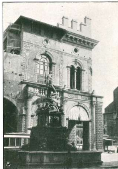
BIFORA PER LA FACCIATA DEL PODESTÀ.