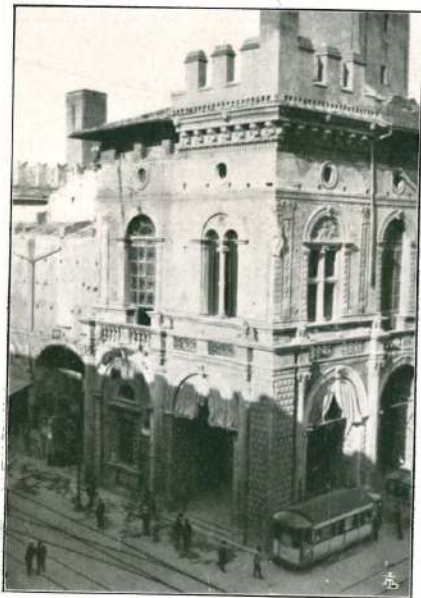
UN FIANCO DEL PALAZZO DEL PODESTÀ.

Propongono, adunque, per il coronamento del Podestà l' attico merlato , per ragioni storiche ed estetiche. I palazzi sorti in Bologna, nel periodo