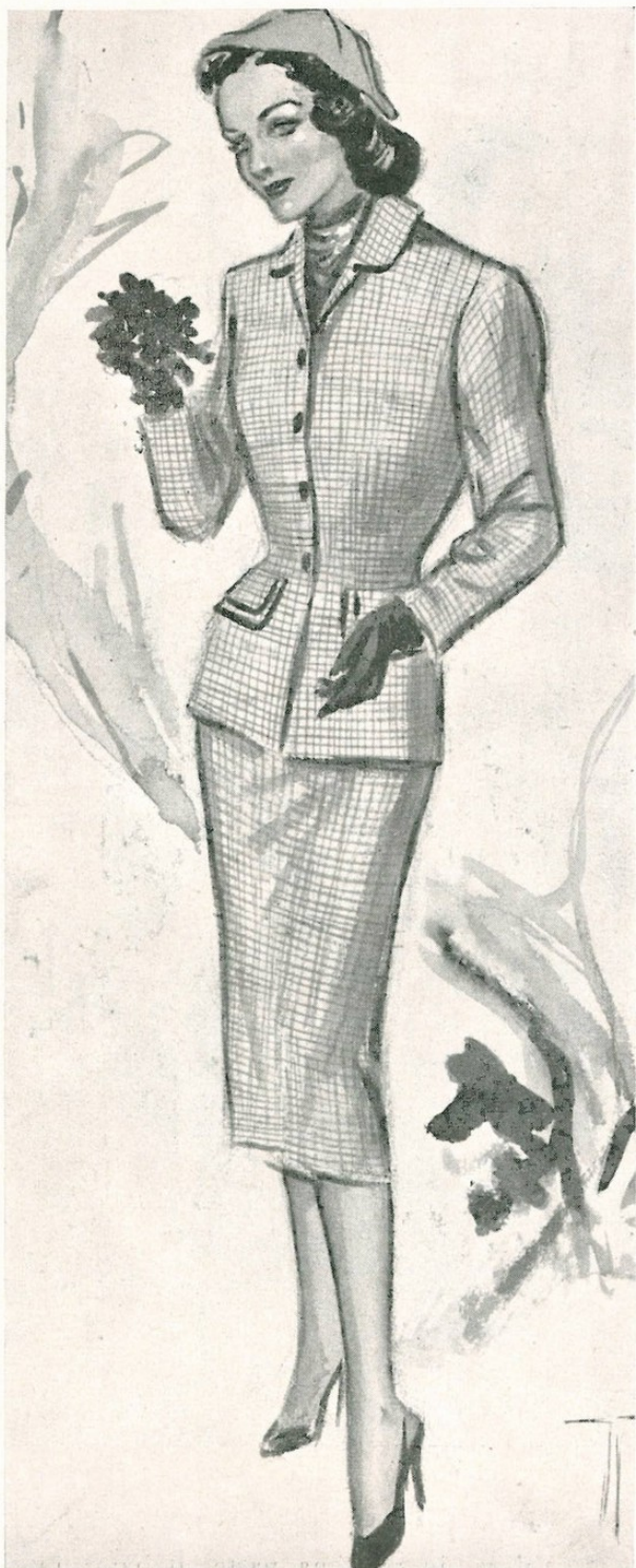
Prezioso amico della "silhouette", femminile l'intramontabile classico TAILLEUR