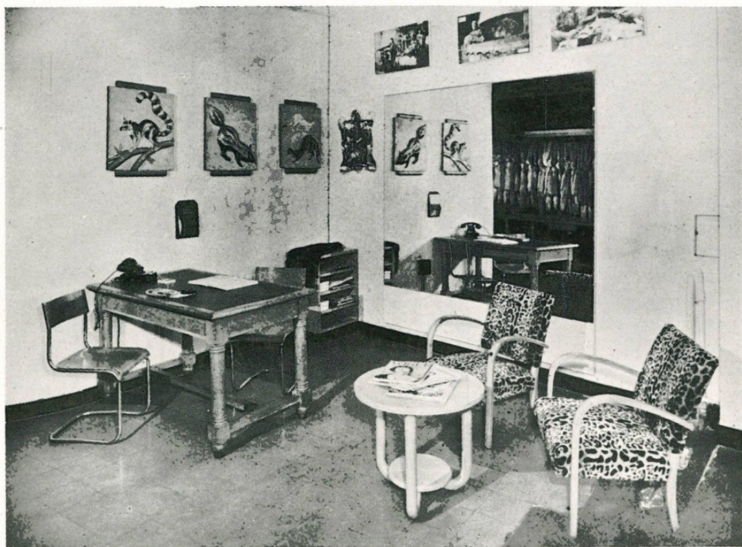
L'angolo di uno degli accoglienti salotti della Sede, a Bologna, dove in sobria eleganza, sono in evidenza motivi decorativi, inerenti alla pellicceria.