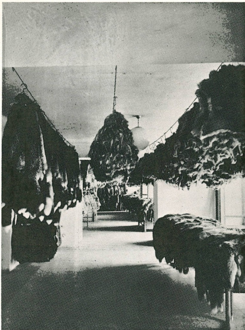
Uno dei Magazzini delle pelli lavorate della Filiale di Milano

Le pelli grezze che affluiscono ai magazzini della Casa, in quantità cospicua, adeguata alle esigenze di una clientela commerciale e privata veramente elette, provengono dai maggiori Mercati del mondo, primi fra i quali, Londra, Montreal, Oslo. E anzi, molto spesso, vediamo Diva Gelosi, in tali Centri, assieme ai propri Commissionari, tra le più alte personalità del mondo della pellicceria, per partecipare direttamente e personalmente alle tradizionali grandi Aste, sia per assicurarsi il meglio delle merci offerte e sia per mantenere frequenti e preziosi contatti col mondo ufficiale del ramo. I giornali e le riviste di quei Paesi, fanno spesso il suo nome e ne documentano, anche con