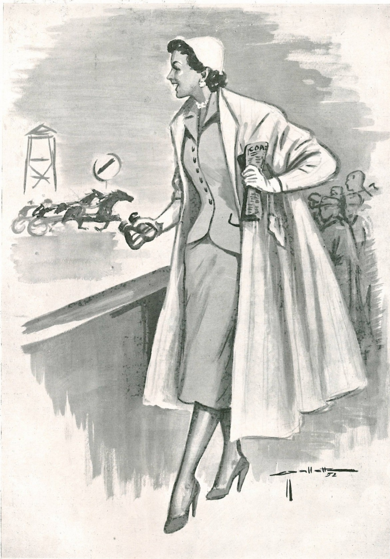
Nelle riunioni ippiche e in tutte le alte manifestazioni sportive, il soprabito in lana bianco o in tinta chiara dà un tono di distinzione all'eleganza dell'abbigliamento