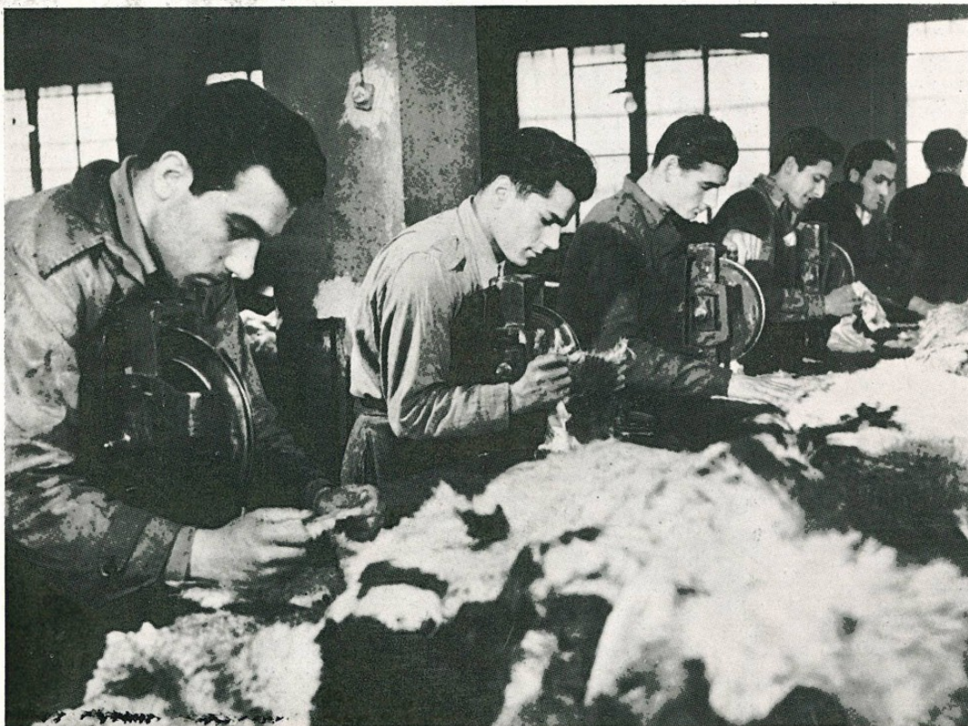
Fase di lavorazione delle pelli, in uno dei reparti della Conceria di Bologna.

ha consentito non solo di allargare sempre più il raggio delle attività, ma di raggiungere tutti gli obiettivi del suo programma di lavoro, completando e perfezionando tutte le strutture dell'Azienda.