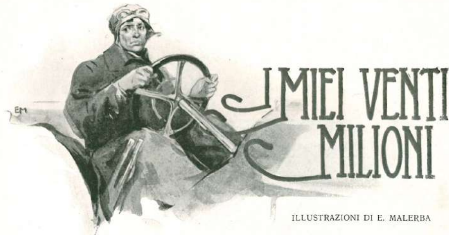
ILLUSTRAZIONI DI E. MALERBA

Io ho la disgrazia di possedere una fortuna di venti milioni. C'è poco da ridere: una rendita di un milione all'anno, tremila lire al giorno. È una cosa imbarazzante, perchè non voglio in nessun modo accumulare dell'altro capitale — per l'amor di Dio! — e non so come spendere dignitosamente tremila lire al giorno, senza farmi rider dietro.