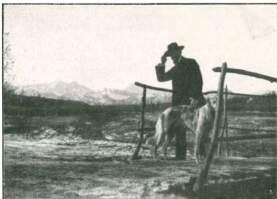
A CUNEO - SULLA STURA, PER IL QUADRO " PONTICELLO DEI SOSPIRI ".

E fisionomico nel suo assieme il disegno del Piatti è, in quanto egli sa trarre i maggiori e più efficaci effetti