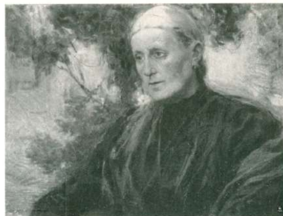
RITRATTO DI MIA MADRE.