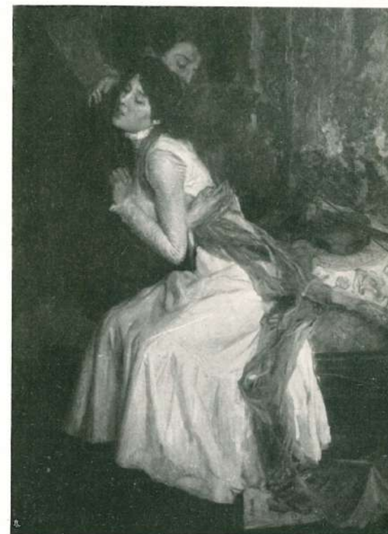
" MALIA " - (ESPOSIZIONE MONDIALE DI BUENOS-AIRES 1910).

Con questo io non intendo stabilire alcun avvicinamento di un tal ordine sul nome di Antonio Piatti. Amo però riconoscere e sottolineare una certa parentela fra l'opera del nostro artista e quella di taluni maestri scomparsi e di qualcuno che ancor è fra noi. Difatti se ben si osservano talune tele del Piatti non si potrà negare che esse rendono di taluni maestri l'interpretazione simpaticamente libera e sintetica, specie per quanto è nei riguardi delle diverse attitudini dei vari personaggi. Talvolta egli si spinge fino a far più specialmente emergere quel dato momento preferito e su di esso vi insiste, per modo che rimanga di preferenza e più vivo negli occhi di chi osserva. E il nostro pittore in questo ha oggimai fatto tale abito e con tanta sensibilità d'artista, che si può ben dire, senza alcun timore di essere accusati di esagerazione, che non per lui è l'appunto rivolto a taluni pittori, ed anche a qualcuno fra quelli che sono celebri, ch'egli sia un apparecchio osservatore: una lode che può essere ba-