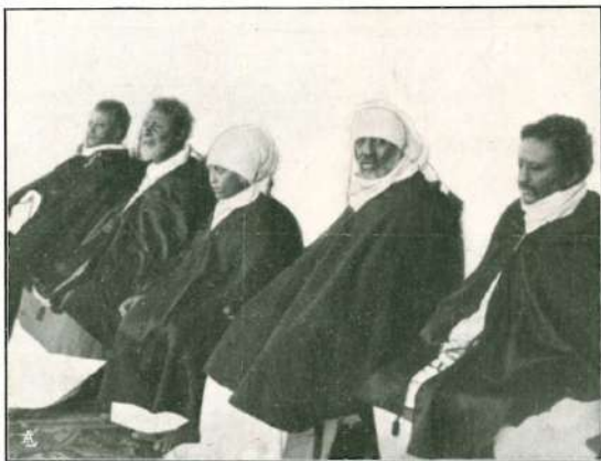
LIGG VASSU ERREDE DEL TRONO E LE REGGENZA, DA SINISTRA: 1. Fitaurari Apte Gheorghis — 2. Ras Tesamma — 3. Ligg Yaasu 4. Ras Mangascià Asachim 5. Ras Gucca, figlio di Ras Olib, ora prigioniero.