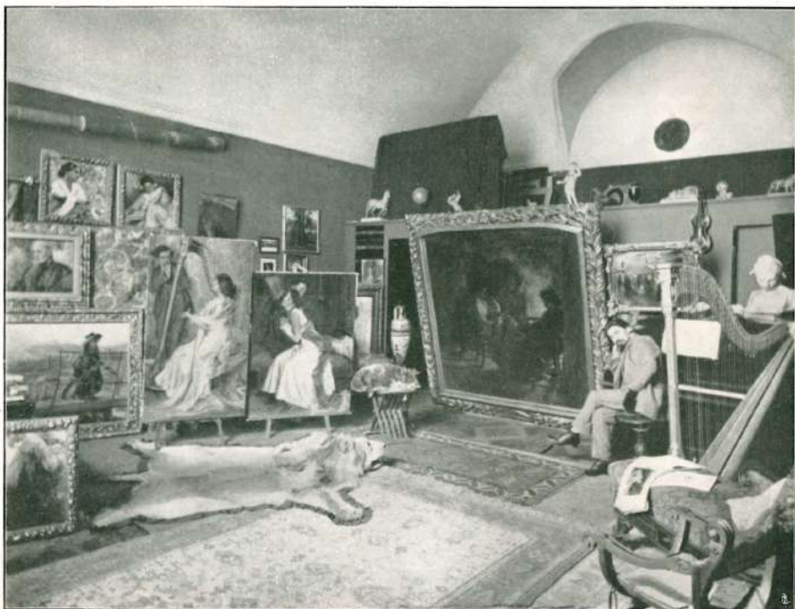
STUDIO DEL PITTORE ANTONIO PIATTI.

buoni effetti di luce è ritenuto uno delle migliore cose uscite dal pennello del nostro artista.