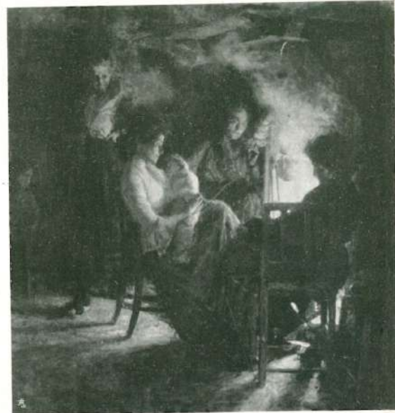
AL FOCOLARE. Esposizione Internazionale di Monaco 1906.

Segui la tela: Gli ultimi momenti di Chopin , ispirata da una poesia di Angiolo Orvieto, e nel 1904 il Piatti vinse un importante concorso, conquistando il pensionato Oggioni. Ma prima di recarsi a Roma, cedendo al desiderio di ammirare nuovi paesi e frequentare gente nuova, trascorse alcuni mesi a Parigi e qui diede nuove pregevoli prove della sua attività artistica. Ecco difatti l' Afranta , che al Salone degli artisti francesi ebbe ottime accoglienze, ed ora