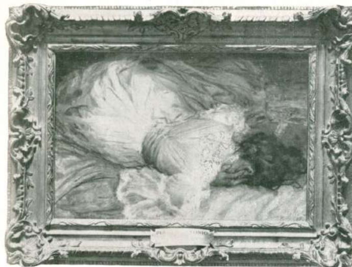
" L'AFFRANTA " - (P. PINACOTECA DI MILANO).

Ed ecco il Piatti espressivo e drammatico in tutte le varie linee che costituiscono l'intera tela: non soltanto nel gesto, non solo nell'espressione dei personaggi, ma in tutto quell'insieme di linee congiungente a rendere armonica l'intera opera. Onde il Piatti ci dimostra ancor una volta quanto giustamente affermasse il Baudelaire, quando diceva, che egli conosceva solo un uomo il quale sapesse dise-