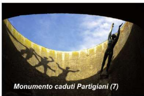
Monumento caduti Partigiani (7)

Al centro del Campo degli Ospedali si trova uno dei migliori esempi del Razionalismo architettonico di metà '900: il Monumento Ossario dei caduti Partigiani (7). Progettato dal milanese Piero Bottoni, per cui vi esegue anche uno dei gruppi scultorei, vede il suo ideale completamento con la collocazione davanti all'ingresso del sarcofago di Giuseppe Dozza, il Sindaco della Liberazione.