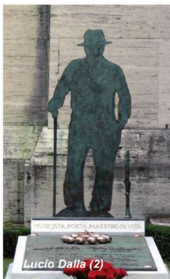
Lucio Dalla (2)