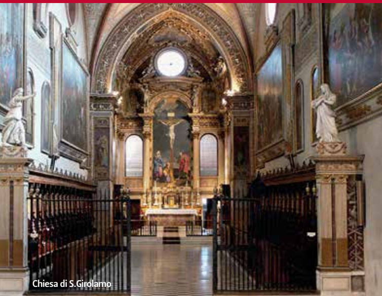
Chiesa di S. Girolamo

Il cimitero viene fondato nel 1801 riutilizzando le strutture del cenobio certosino edificato a partire dal 1334 e soppresso da Napoleone nel 1796. La chiesa di S. Girolamo (1) è testimonianza della ricchezza perduta del monastero. Alle pareti spicca il grande ciclo di dipinti dedicati alla vita di Cristo, realizzato dai principali pittori bolognesi della metà del XVII secolo.