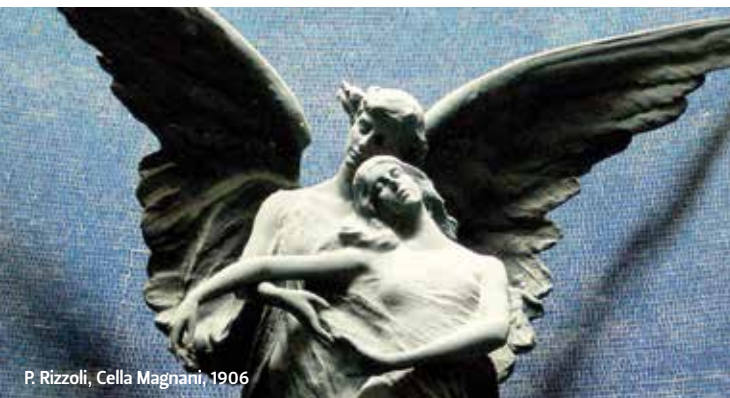
P. Rizzoli, Cella Magnani, 1906

I tre campi riservati agli ebrei a partire dal 1869, sono testimonianza visibile a Bologna della piccola ma importante comunità giudaica locale. Oltre alle semplici memorie che rispecchiano i dettami religiosi, si trovano monumenti di maggior impegno monumentale, a volte ornati da ritratti, sintomo della volontà di segnalare, dopo il raggiungimento dei diritti civili e religiosi di fine '800, l'appartenenza alla società italiana.