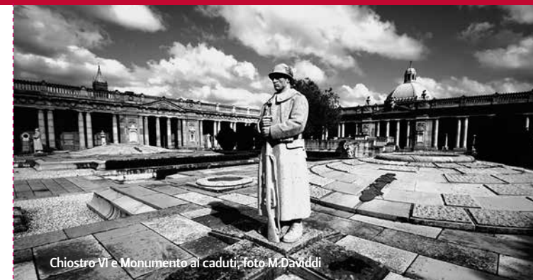
Chiostro VI e Monumento ai caduti