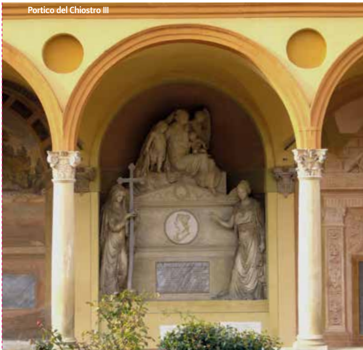
Portico del Chiostro III