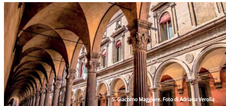
S. Giacomo Maggiore.

Del medievale foro dei Mercanti nelle adiacenze della Porta Ravennana sopravvive solo una parte degli edifici porticati, sebbene fortemente restaurati o addirittura in larga parte ricostruiti. Lo spazio irregolare è dominato dalla Loggia della Mercanzia (1384), capolavoro dell'architettura tardogotica dal maestoso portico con ampie volte a crociera rette da pilastri polistili. Sullo slargo si elevano anche i portici lignei delle case Seracchioli, frutto di una reinvenzione stilistica del secolo scorso (1928), per conferire al contesto ambientale un carattere neogotico.