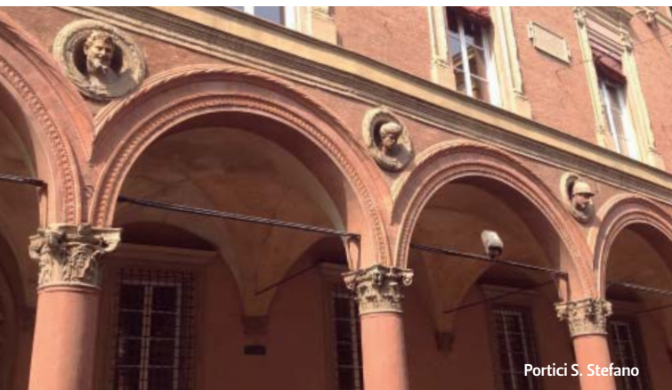
Portici S. Stefano