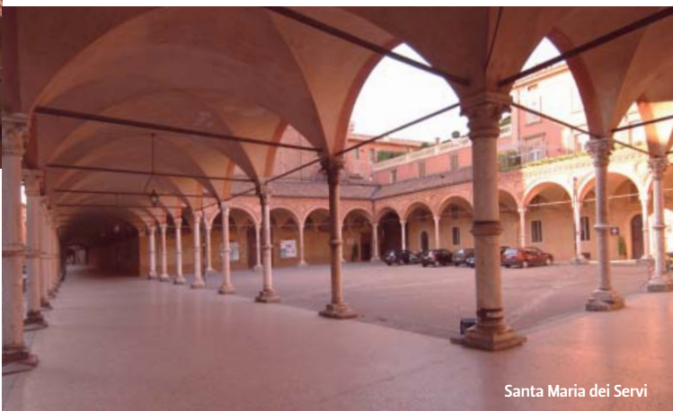
Santa Maria dei Servi

Di notevole interesse è l'arioso porticato che si estende sul fianco settentrionale della basilica di Santa Maria dei Servi, avviato nella seconda metà del XIV secolo forse su disegno di Antonio di Vincenzo e realizzato con ampie volte a crociera su esili colonnine in marmo dal caratteristico raccordo anulare a metà del fusto. Sempre sul versante sud della strada, si può ammirare poi, al n. 19 lo slanciato portico ligneo (alto oltre 9 metri) della casa Isolani uno degli esempi meglio conservati di portico tardo medievale, restaurato nel 1877. Altrettanto particolare è il portico davanti all'ingresso della chiesa barocca di San Bartolomeo, adiacente alle due torri, che sfrutta il loggiato del cinquecentesco e incompiuto palazzo Guastavillani, i cui possenti pilastri presentano raffinate (e oggi molto rovinata) decorazioni rinascimentali in arenaria.