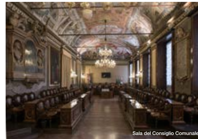
Sala del Consiglio Comunale

Questa parte del palazzo è la più antica, cresciuta intorno al primitivo nucleo delle case del giurista Accursio (da cui ancora oggi la denominazione dell'intero complesso), acquisite dal Comune nel 1287. Alla fine del secolo vi si trovava il magazzino per le pubbliche scorte di cereali (da cui l'antica denominazione di Palazzo della Biada). Conserva