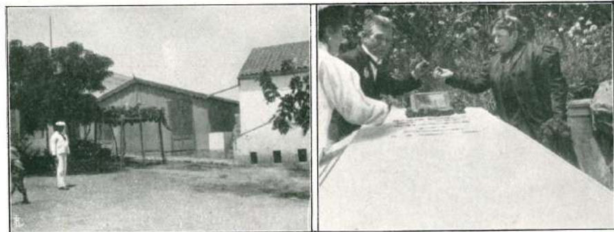
La famosa casa di ferro regalata dagli Inglesi a Garibaldi.