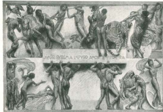
" L'AMORE " - DECORAZIONE PITTORICA DI ARISTIDE SARTORIO alla VII Esposizione Internazionale d'Arte a Venezia 1907.

Tali pubblicazioni, ese- guite con tutte le raf- finanze dell'arte gra- fica, costituiscono di per sé stesse un'opera d'arte decorativa. Col- locate in un salotto a- dornano come un bel vaso o una bella stoffa. Le singole incisioni, le stampe di cui oggi se ne annoverano molte pregevolissime hanno un compito decorativo nell'arredo di una ca- mera come i quadri.