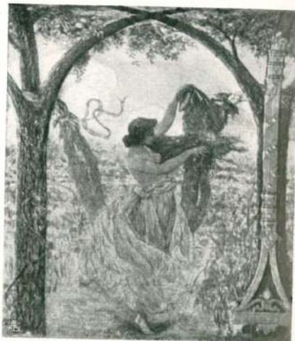
PANNELLI DECORATIVI DI CESARE LAURENTI NEL RISTORANTE "STORIONE" DI PADOVA.

di Modelli d'arte decorativa , testè pubblicata in fascicoli dagli editori milanesi Preiss e Bestetti.