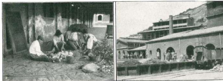
Rompendo il minerale.