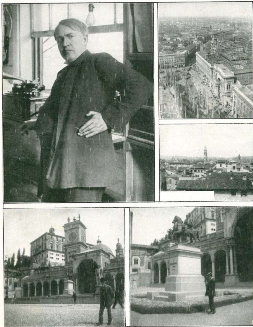
1. - Uno dei recenti ritratti di Edison.