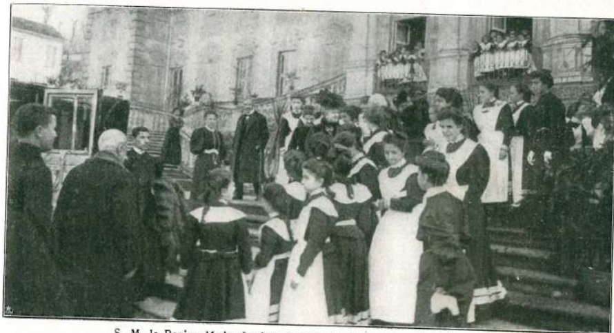
S. M. la Regina Madre fra le collegiali s'avvicina al proprio automobile.