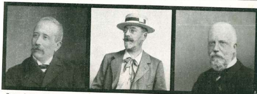
Comm. AUGUSTO MORICONI, nato a Roma nel 1844, † a Roma il 26 dicembre 1907. Insigne organista e compositore di musica sacra.