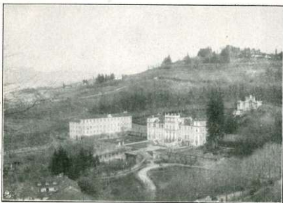
Veduta generale dell'Istituto Nazionale.