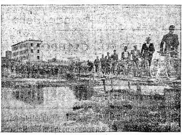
La passerella sul Reno che attende il suo... doppio binario