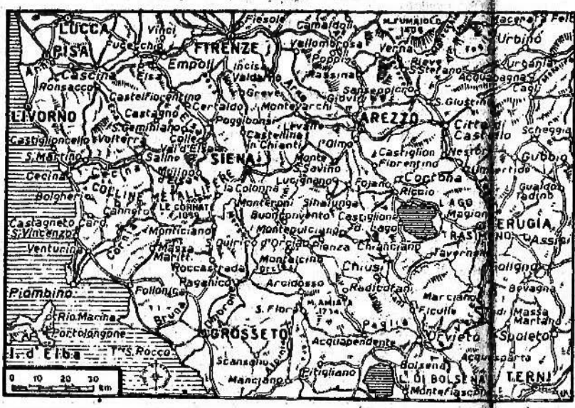
LA LOTTA DAL TIRRENO ALL'ADRIATICO