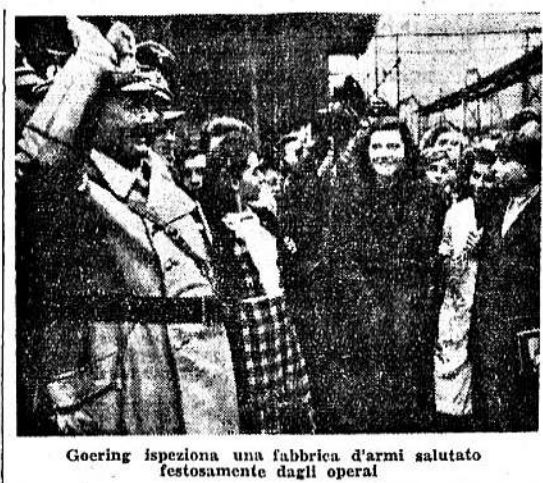
Georing ispeziona una fabbrica d'armi salutato festosamente dagli operai