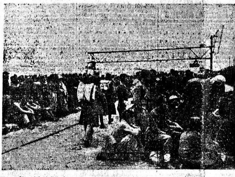
Ecco mille prigionieri inglesi catturati nell'Esco che indaranno tra breve la marcia verso Berlino che era nella loro intenzione ma in una maniera ben diversa da quella sognata

Roma, 27 novembre Sulla figura del conte Sforza, già ministro degli Esteri di S. Massimo e suo degno complice, continuano a venire in luce episodi uno più edificante dell'altro. E' interessante rilevare in proposito un giudizio che Antonio Salandra, l'antifascista nel suo volume sull'antifascismo, non puo non segnalare la mia sorpresa - egli dice - nel leggere molti documenti del periodo in cui Salandra, sotto il nome di Fedullo, scorre il Libro Verde da noi pubblicato nel maggio 1915 ebbe, per assoluta mancanza di idealismo e per bassa levatura morale, una stretta di cuore in un momento di quella che provò nei più oscuri momenti della guerra. « Non avrei mai sospettato una così squisita sensibilità nel vostro ministro degli Esteri, che a Rapto non si fece scrupoli di consegnare sotto il banco ai negoziatori stranieri una lettera impegnativa di rinuncia, che poi dovette ripare e poi ancora confessare nel momento.