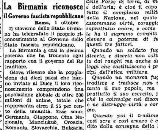
La Birmania riconosce il Governo fascista repubblicano