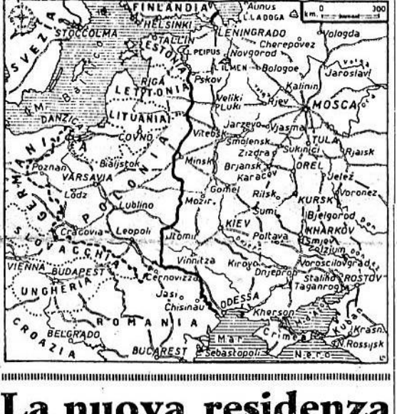
La nuova residenza del Governo italiano

Bucarest, 8 ottobre. Occupandosi della nuova offensiva propagandistica sferrata dagli anglo-americani in direzione della Romania, alla quale Londra e Washington vogliono attualmente insistere, esortazioni perché si disponga ad un accordo separato con la Russia, un portavoce del Governo rumeno ha dichiarato quanto segue: «Lo scopo dei bolscevichi è quello di eliminare la Romania, che rappresenta un ostacolo sul cammino dell'espansione verso i Balcani...»