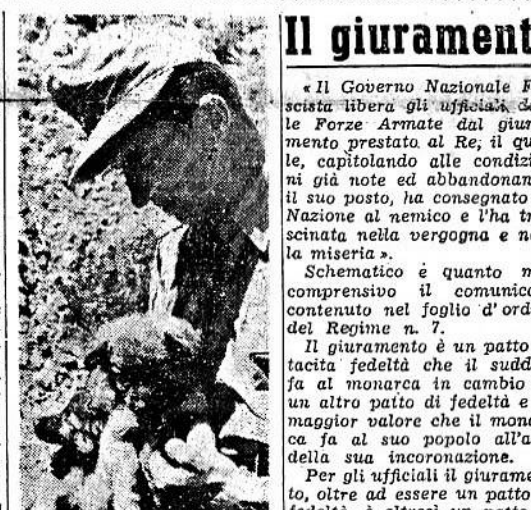
Portafortuna in una battaglia germanica del fronte est.