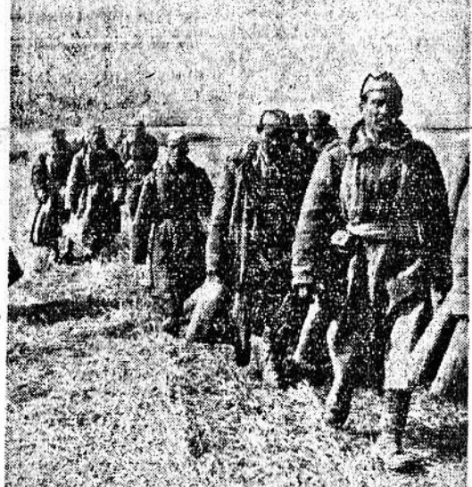
Prigionieri sovietici vengono avviati nelle retrovie.