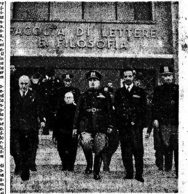
Il Duce esce dalla Città Universitaria a Roma dopo aver partecipato alla seduta inaugurale del convegno della Società per le Scienze

«Durante la seduta del Reichstag del 10 settembre 1939 io ho precisato due cose: 1) come dopo che questa guerra ci fu imposta nessuna forza armata nel tempo potesse mai batterci; 2) che se il giudizio riusciva a prosciogliere il nostro popolo, noi non eravamo in grado di restituire al mondo un altro pezzo di terra.»