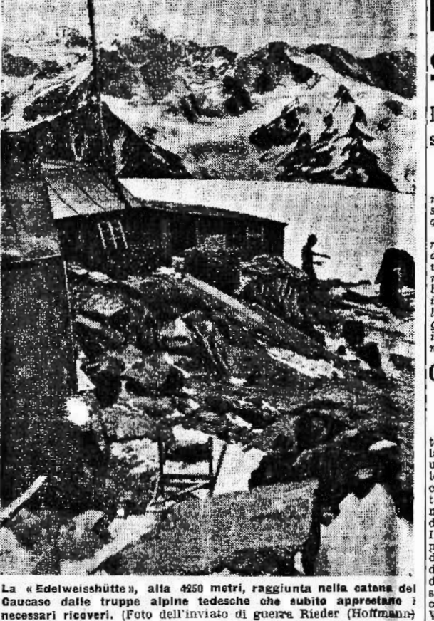
La "Edelweissbütte", alla 4250 metri, raggiunta nella catena del Caucaso dalle truppe alpine tedesche...