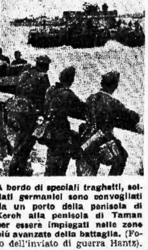
A bordo di spezzati traghetti, soldati germanici sono convogliati da un porto della penisola di Koron alla penisola di Tamam per essere impiegati nelle zone più avanzate della battaglia.

«Tu sei ubriaco, disgraziato!» urlò Natalia, agitando un mazzo di sedani sotto il naso del ronfante Simone.