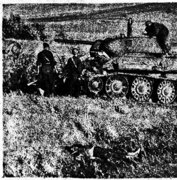
Soldati italiani osservano un carro armato sovietico catturato dall'Armi nelle recenti operazioni sul Don

UNA LACRIMA IL POPOLO APPRENDE IL CULTO DELLA STORIA... Abbiamo visto al cinematografo, recentemente, dei film a fondo storico-patriottico, contemporaneo e del Risorgimento. Per esempio: Giacobbe ed il Garibaldino al Convento. In quest'ultimo, figura per breve tempo anche Nino Bixio. Così il cinema contribuisce a circondare la storia patria di un'aurora di romanzesco.