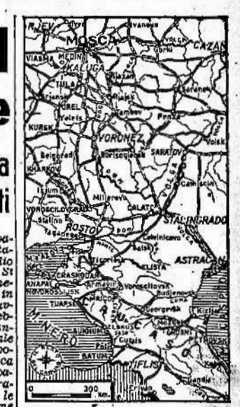
Map showing military positions and movements in the Caucasus region, including locations like Anapa, Taman, and Novorossijsk.