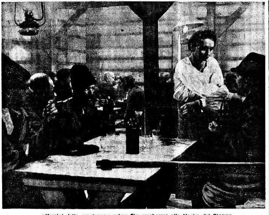
Uomini della montagna primo film ungherese alla Mostra del Cinema