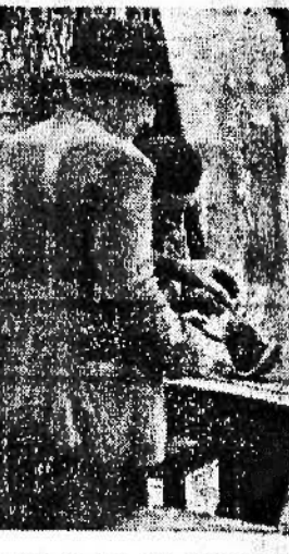
La stagione dei cocconi è nel suo pieno sviluppo: una fresca fetta della dolce cucurbitacea fa raccogliere attorno ai prezzi tavoli di vendita anche i nostri bravi soldati!