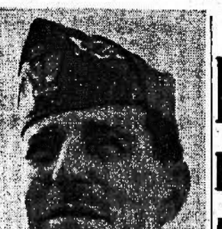
Il Maresciallo d'Italia Ettore Bastico

Roma, 11 agosto Al generale d'Armata Ettore Bastico, comandante superiore delle Forze Armate nell'Africa settentrionale italiana, è stato conferito per merito di guerra il grado di Maresciallo d'Italia. Già comandante superiore delle Forze Armate dell'Egeo, egli organizzò la difesa di quel possedimento così efficacemente