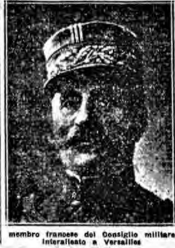
Generale Foch, membro francese del Consiglio militare interalleato a Versailles