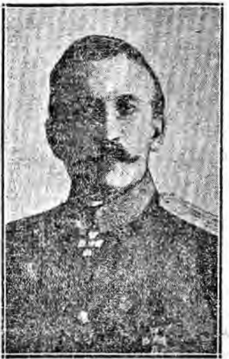
Il generale Korniloff, che guida la valorosa truppa della Russia rivoluzionaria...

Fronte polare-tedesco. - Il comunicato polare in data del 15 dice: «L'ala di artiglieria di sinistra del fronte di battaglia di Verdun, l'intensità del fuoco dell'artiglieria tedesca è diminuita».